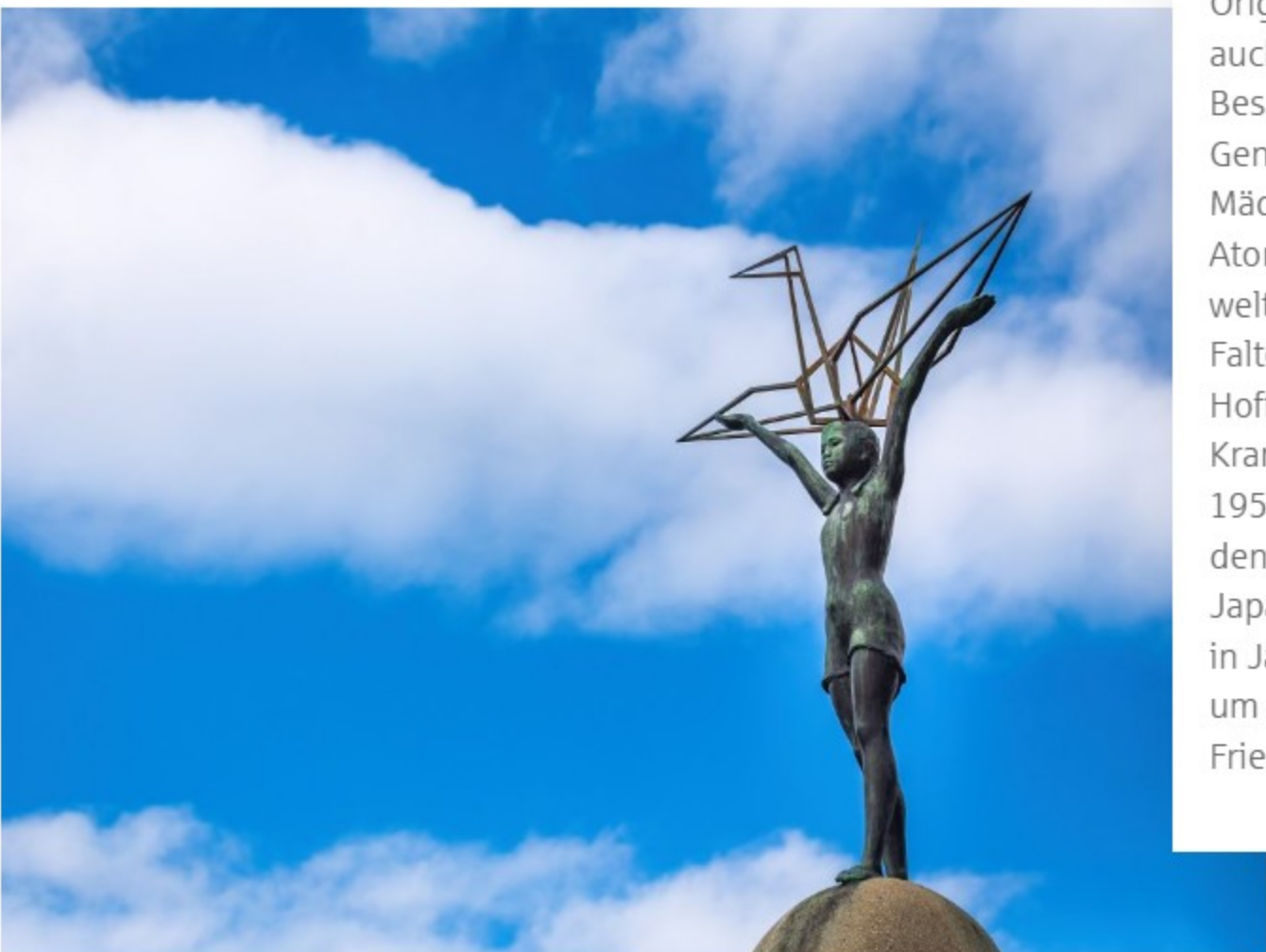
Kinder-Friedensdenkmal in Hiroshima von SANCHAI – Adobe Stock