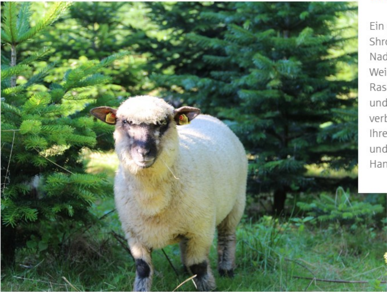
Ich halte die Bäume fit, ohne daran zu knabbern – ein echtes Profi-Lamm eben!

Ein ganz besonderer Teil der Mittelmühle-Kultur sind die Shropshireschafe. Diese einzigartige Rasse, die keine Nadelbäume frisst, sorgt für die Pflege der Weihnachtsbaumkulturen. Als natürliche „Öko-Rasenmäher“ halten sie die Flächen frei von Begleitwuchs und liefern wertvollen Dünger, der die Bodenqualität verbessert und die Weihnachtsbäume optimal versorgt. Ihre zutrauliche Art macht sie zu Lieblingen bei Besuchern, und ihr Einsatz zeigt, wie Landwirtschaft und Naturschutz Hand in Hand gehen können.