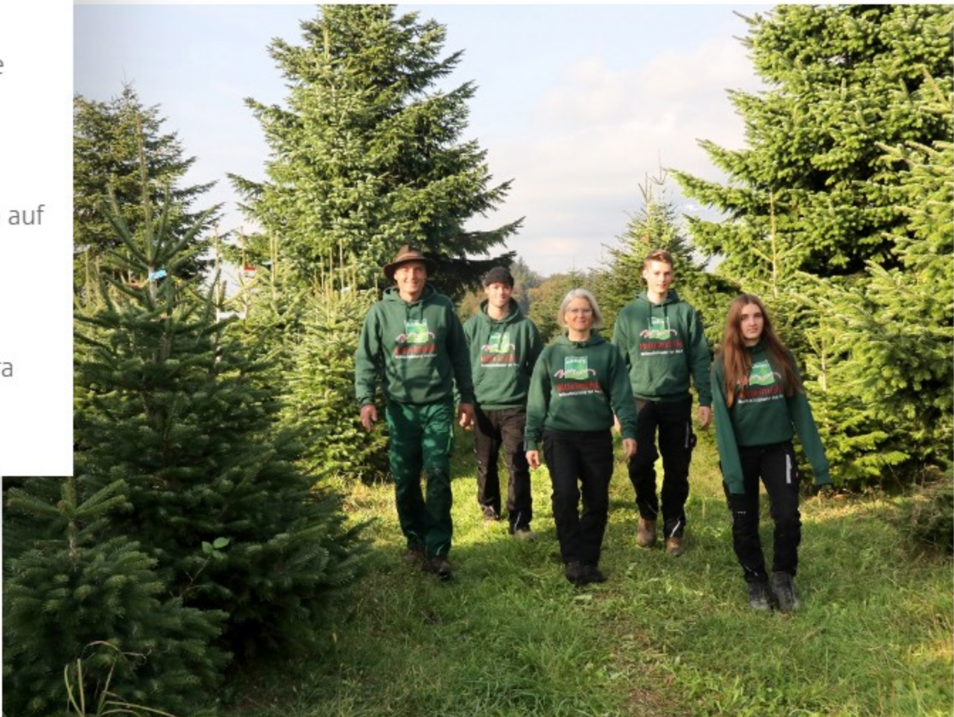
Familie Müller – Mit Herz und Hand für die perfekte Weihnachtsbaum-Erntel

Seit fast 50 Jahren steht die Familie Müller für regionale Qualität und ökologische Verantwortung. Die Dauerbegrünung ihrer Felder fördert die Vielfalt an Insekten und Kleintieren, während das durchdachte System der Dauerkultur mit Schafbeweidung die Böden auf natürliche Weise stärkt. Dank der nachhaltigen Bewirtschaftung ist die Mittelmühle bestens für den Klimawandel gerüstet und liefert nicht nur Weihnachtsbäume, sondern auch Lebensräume für Flora und Fauna.