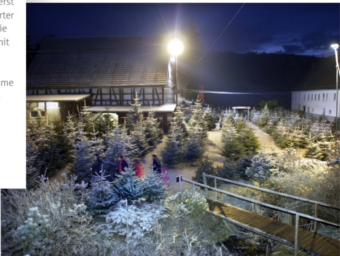
Am heiligen Abend kann man noch von 10 - 14 Uhr einen Christbaum kaufen