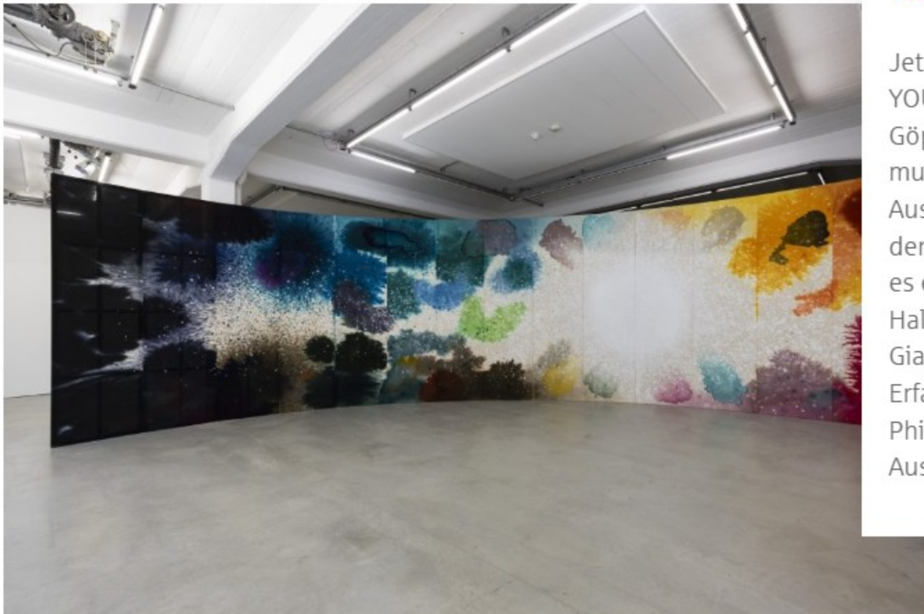
ALL THAT YOU SEE - Kunsthalle Göppingen