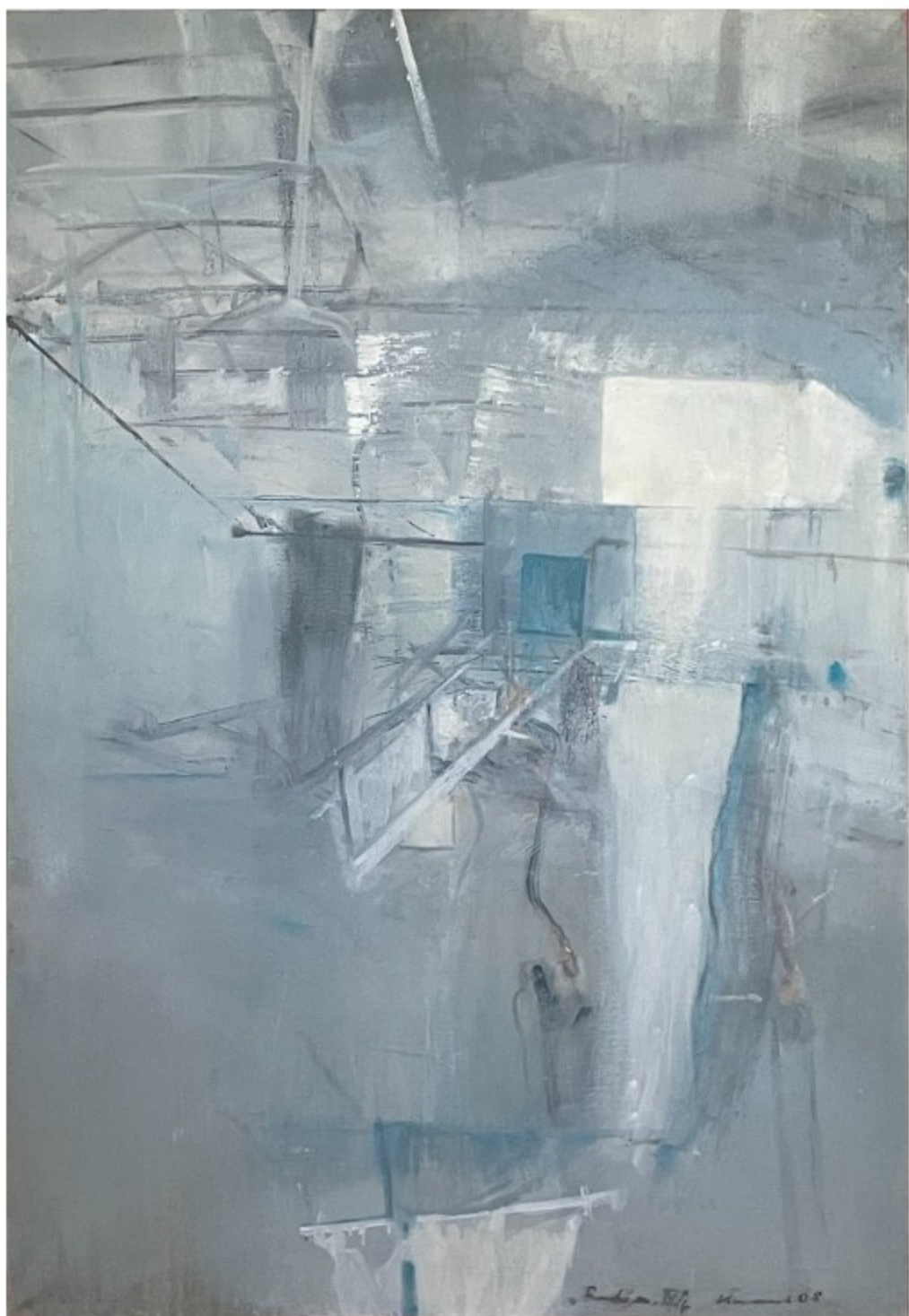
Hummel, Rondo martiale, IV-4, 2008, Öl-Leinwand