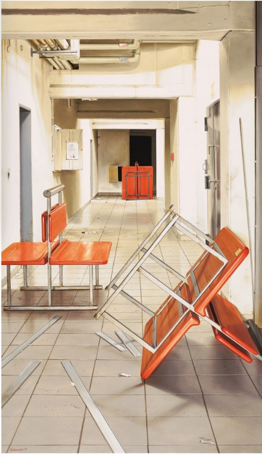
Stefan Bircheneder, Serviervorschlag, Öl auf Leinwand, 2017