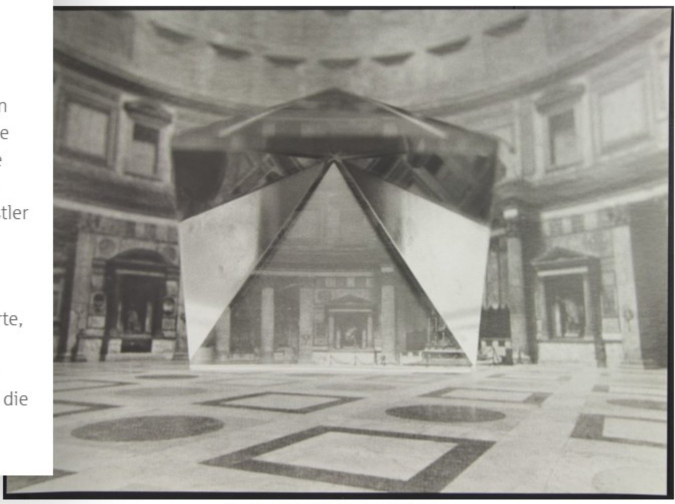
Klaus Heider, Pyramide im Pantheon