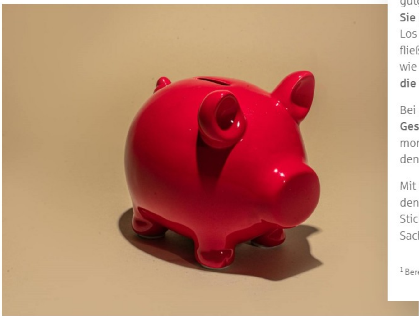
PS-Sparen und Gewinnen macht's möglich!