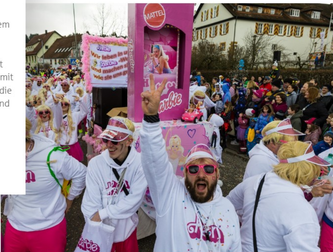
„Wir leben in unserer Barbie-Welt, und machen sie uns, wie sie uns gefällt“: Der Stammitsch „BimBamBino“ setzt ein klares Zeichen.

Thematisch wird der Donzdorfer Fasnetsumzug in diesem Jahr erneut eine breite Palette an aktuellen gesellschaftlichen und politischen Themen aufgreifen. Besonders im Fokus steht die Künstliche Intelligenz, mit gleich zwei Wagen, die sich auf unterschiedliche Weise mit der Thematik auseinandersetzen. Weitere Themen, die die Donzdorfer Narren humorvoll und kreativ behandeln, sind unter anderem Donald Trump, SpaceX und gesellschaftliche sowie sportliche Themen. Der Umzug bietet damit nicht nur ein visuelles Spektakel, sondern auch eine Plattform für satirische und gesellschaftskritische Reflexionen.