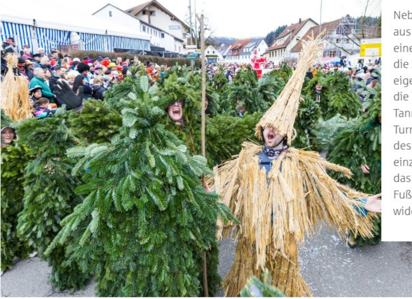
Die Zunft der Stroh- und Tannenmänner bei der Donzdorfer Fasnet.

Neben den beeindruckenden Wagen sorgt die Mischung aus traditionellen Gruppen und neuen Teilnehmern für eine besondere Atmosphäre. In diesem Jahr dürfen sich die Salacher Fasnet und die Nenninger Hopfakloper mit eigenen Wagen zum ersten Mal präsentieren. Doch auch die langjährigen Mitstreiter wie die Stroh- und Tannenmänner, der Musikverein Donzdorf und die Turngemeinde sind erneut dabei und tragen zur Vielfalt des Umzugs bei. So lebt die Donzdorfer Fasnet von einem einzigartigen Zusammenspiel aus Tradition und Moderne, das sich in den farbenfrohen Wagen, den kreativen Fußgruppen und der stimmungsvollen Musik widerspiegelt.