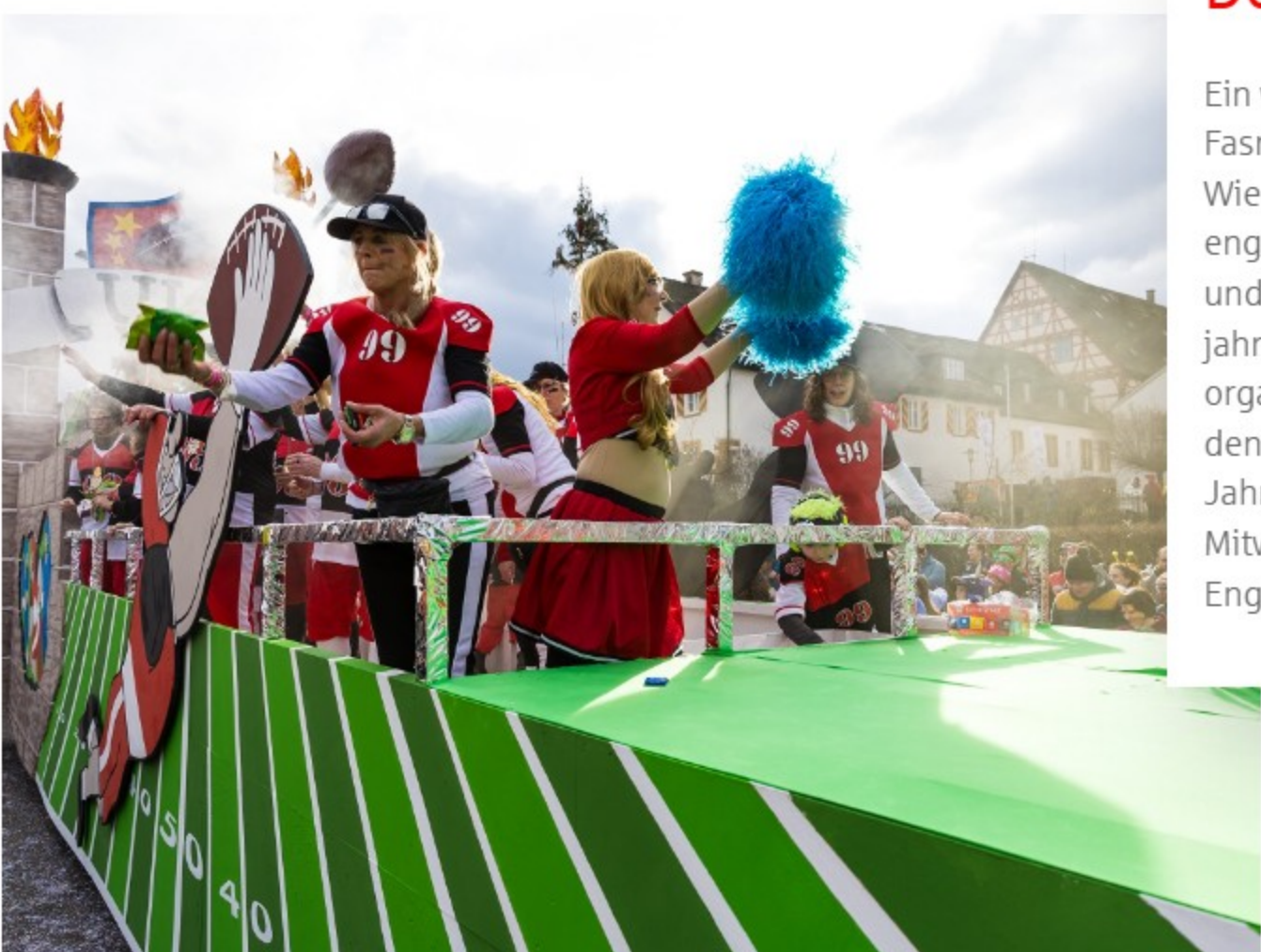
Die Unterdorfer Lausbuben beim Fasnetsumzug 2024 als Footballer und Cheerleader.