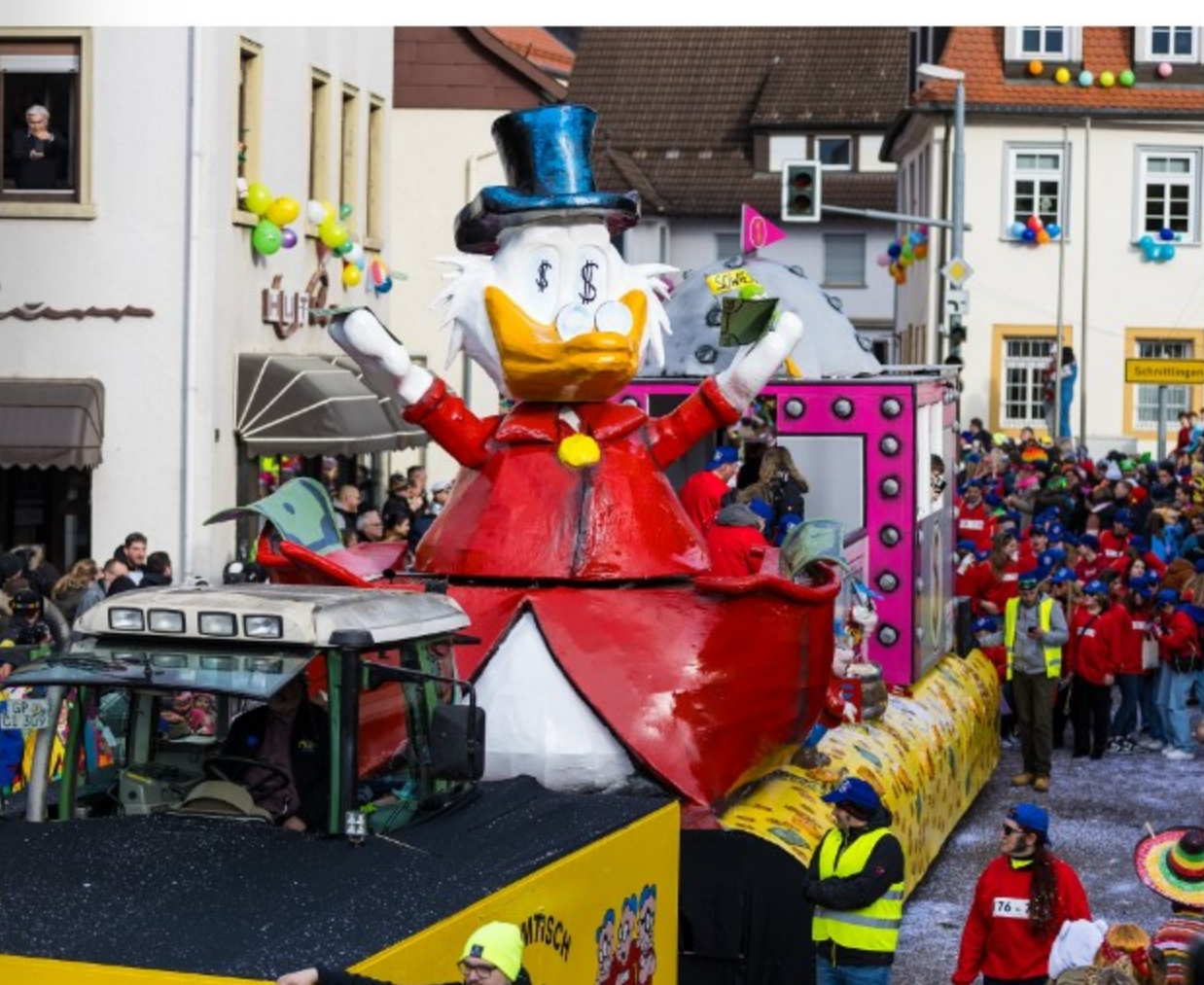
Der 'Dagobert-Duck-Wagen' des 'Stammitsch Sowieso' – ein humorvolles politisches Statement zur Ampel-Regierung.

Der Donzdorfer Fasnetsumzug ist ein wahres Meisterwerk, das durch die einzigartige Tatsache besticht, dass der Umzug in großen Teilen von lokalen Gruppen gestaltet wird, die sich dabei stark am rheinischen Karneval orientieren. Besonders hervorzuheben sind die 18 gigantischen Motiwagen, die bis zu 30 Tonnen wiegen und bis zu 7 Meter hoch sind. Diese beeindruckenden „fahrenden Kunstwerke“ bestehen aus Stahl- und Holzkonstruktionen, die mit Drahtgitter und Pappmaché verkleidet sind. Die detailgetreue Bemalung erfolgt von Hand, und einige Wagen lassen sich sogar pneumatisch oder hydraulisch bewegen. Diese technische Raffinesse wird durch moderne CAD-Konstruktionen unterstützt, bei denen Ingenieure und Statiker für die präzise Planung der Lasten und Kräfte sorgen.