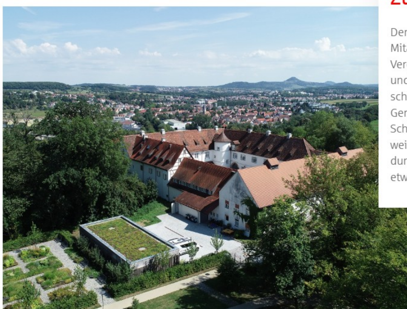
Ein neuer Abschnitt für das Schloss und seine Zukunft.

Der ausscheidende Geschäftsführer dankte den Mitarbeiterinnen und Mitarbeitern, allen Akteuren und Vereinen für ihr Engagement zum Wohle des Schlosses und dessen Entwicklung. Er blicke zurück auf eine sehr schöne Zeit, die er nicht missen wolle – eine Zeit mit vielen Gemeinsamkeiten und tollen Kontakten. Er wünschte dem Schloss, den Akteuren und dem neuen Geschäftsführer weiterhin viel Erfolg. Schlussendlich bleibe er dem Schloss durch die Mitgestaltung kleinerer Formate ja auch noch etwas erhalten.