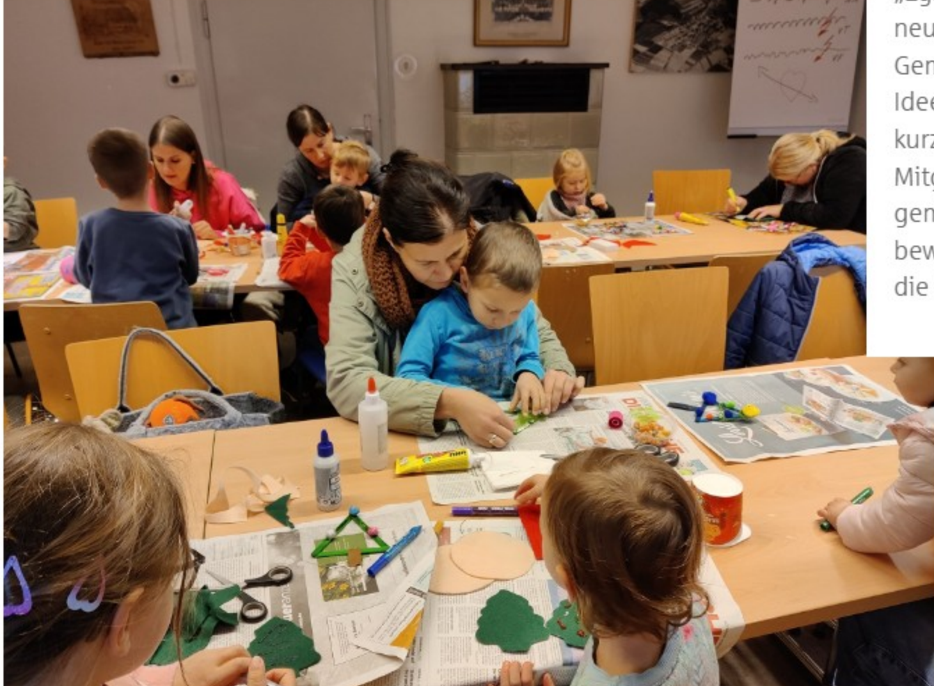
Gemeinsames Basteln.