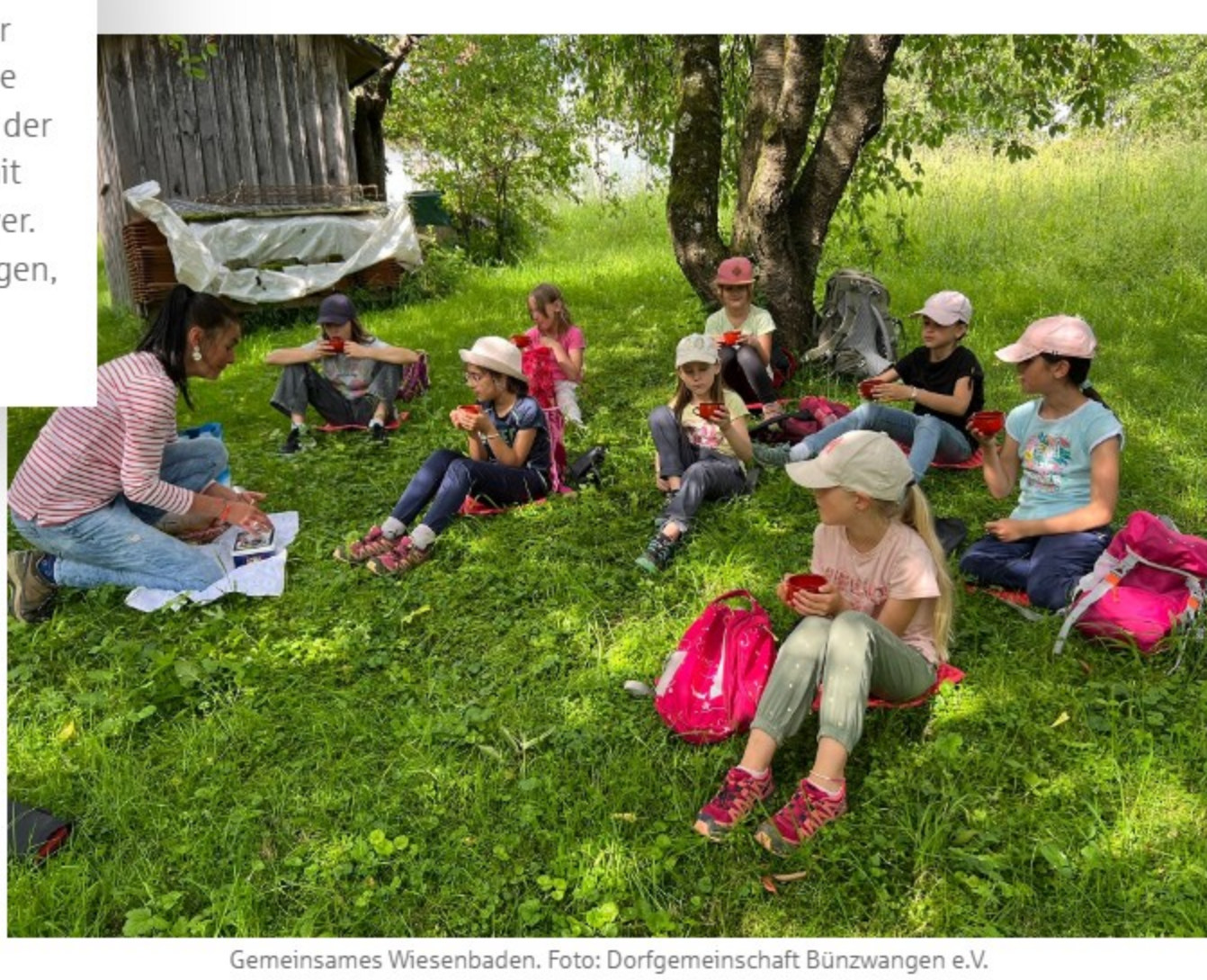
Gemeinsames Wiesenbaden.