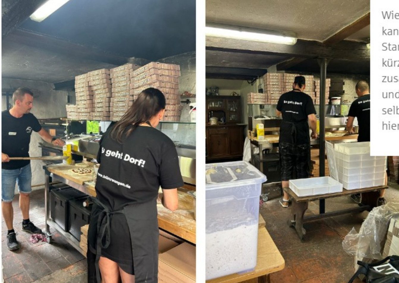
Aktion „oifachPIZZA“.

Wie stark der Zusammenhalt einer Dorfgemeinschaft sein kann, haben die Bünzwanger im Juni 2024 nach dem Starkregen-Ereignis unter Beweis gestellt. Innerhalb kürzester Zeit wurden über die sozialen Netzwerke Helfer zusammengetrommelt, Spenden gesammelt, Hilfskräfte und Betroffene mit Essen und Trinken versorgt. „Wir waren selbst überwältigt von der Welle der Hilfsbereitschaft, die hier zustande kam“, freut sich der Vereinsvorsitzende.