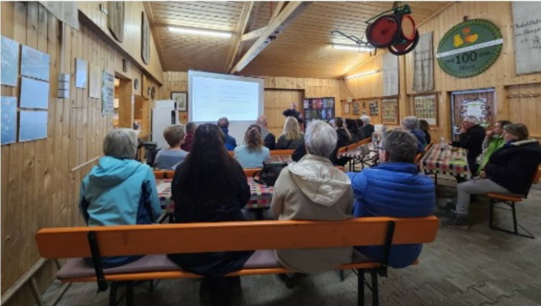
Vortrag mit dem Gartenhof Jeutten.