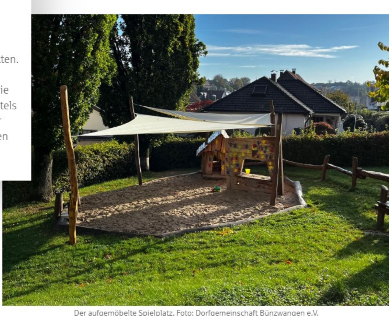
Der aufgemöbelte Spielplatz.

Mittlerweile reicht die Bandbreite von kleineren Einzel-Events, wie ein Gin-Tasting oder eine Ladies-Night mit Cocktails im Backhaus über regelmäßige, kreative Gruppentreffen bis hin zu langfristig angelegten Projekten. So konnte bereits in viel Eigenarbeit ein Spielplatz aufgemöbelt werden und es gibt einen Bauwagen für die Jugendlichen. Mit dem Bau von Nistkästen, Insektenhotels und Baumpflanz-Aktionen kümmern sich die Mitglieder gemeinsam mit dem Obst- und Gartenbauverein um den Erhalt der Streuobstwiesen rund ums Dorf.