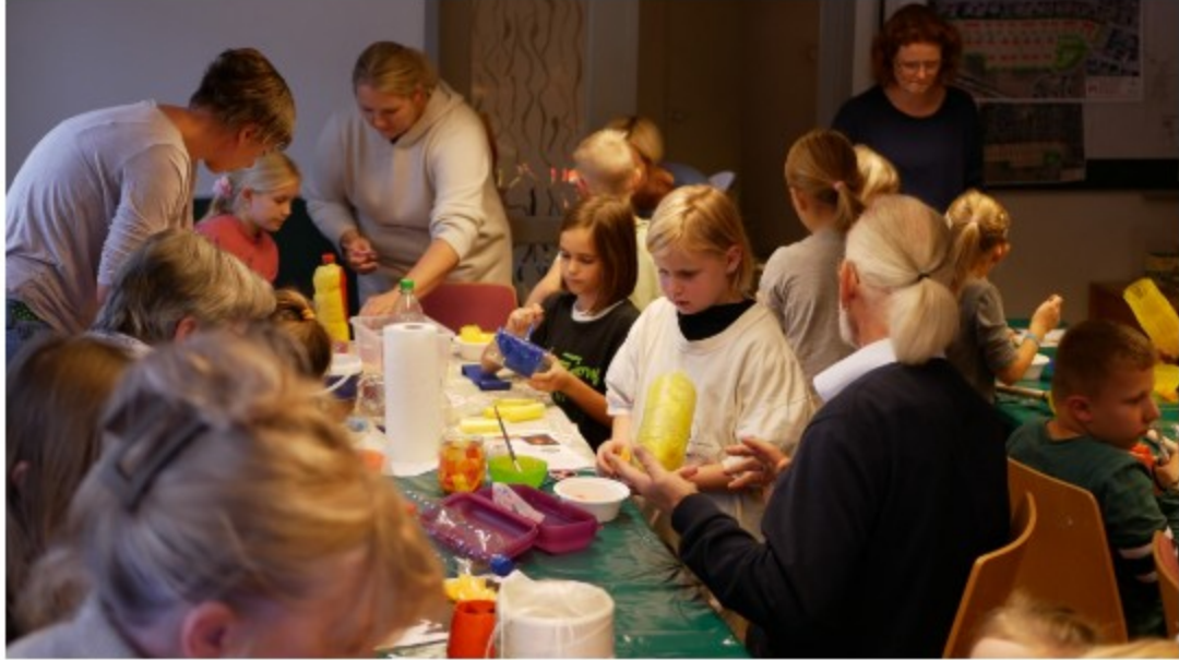
Mit den Großeltern Laternen bauen.