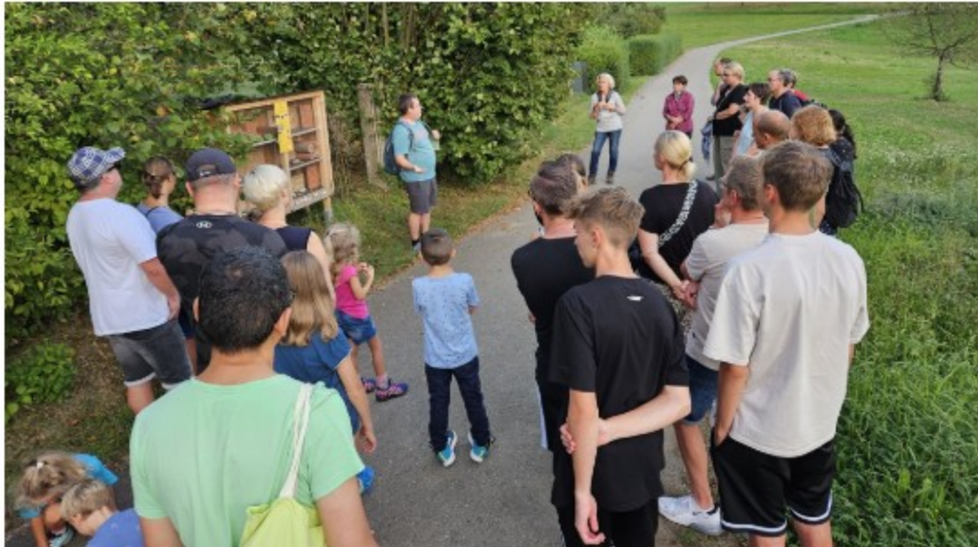
Fiedlerautour mit NABU.