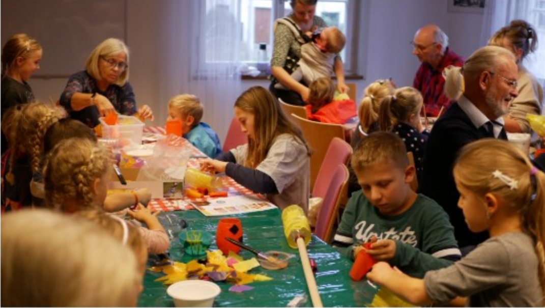
Kreatives Miteinander für Jung und Alt.