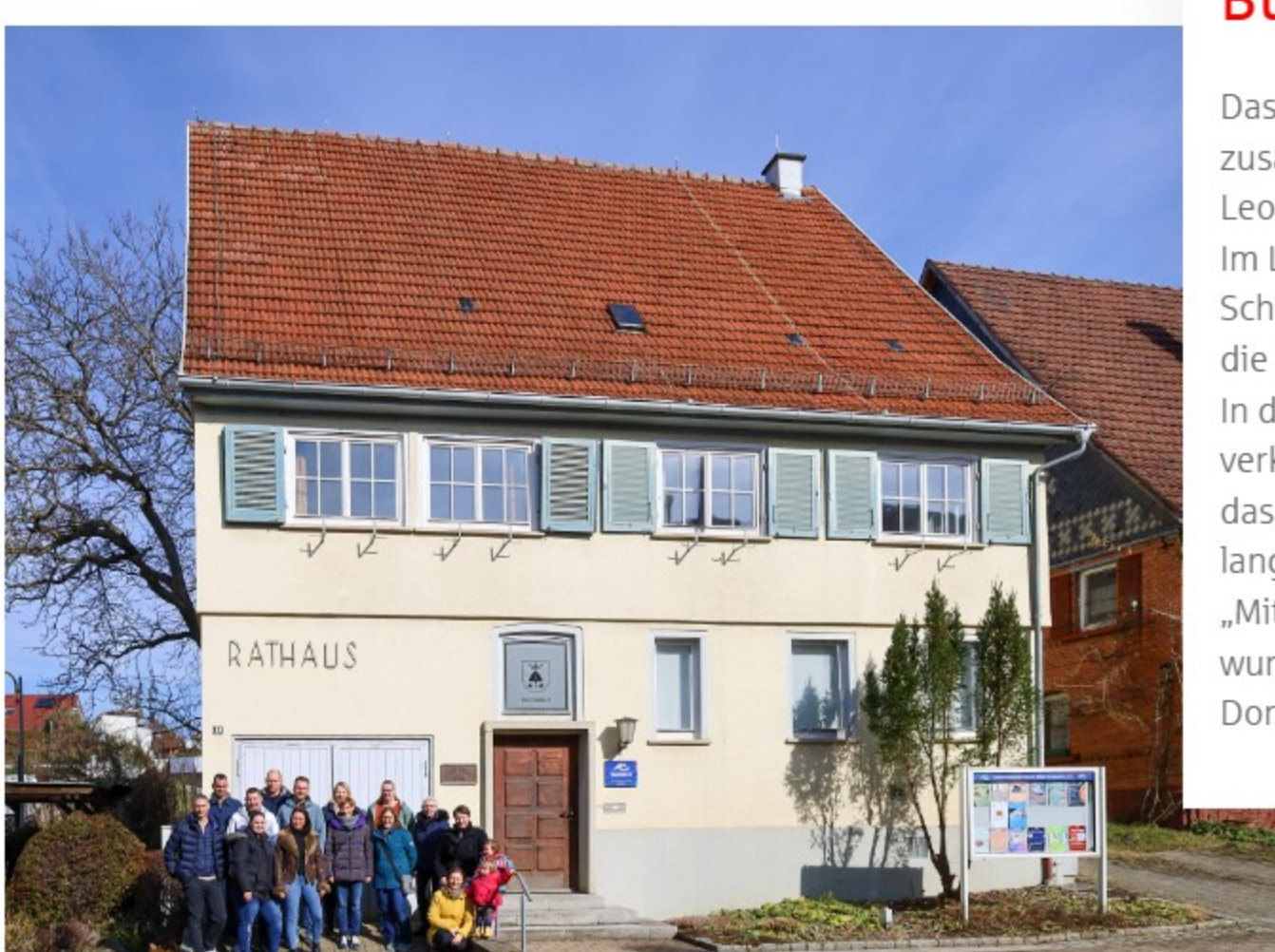
Das historische Rathaus Bünzwangen – ein Haus mit Zukunft.