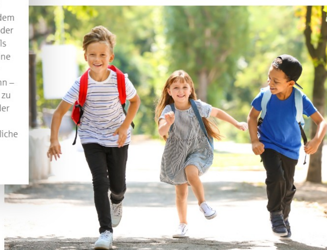
Bewegung macht Spaß.

Innerhalb von sechs Wochen mindestens 20-mal ohne Elterntaxi in die Schule zu kommen. Ob mit dem Rad, dem Tretroller oder zu Fuß – Hauptsache das Auto bleibt in der Garage. Kinder, die diese Aufgabe meistern, erhalten als Anerkennung für so viel Bewegung und Klimaschutz eine SpoSpiTo-Urkunde! Doch der eigentliche Lohn ist eine tägliche Bewegungs-Einheit noch vor Unterrichtsbeginn – und der Stolz, den Weg zur Schule selbst zurückgelegt zu haben. Vielleicht spart das morgens sogar Zeit. Denn der Stau und das Verkehrschaos vor der Schule entfallen prompt. Für die Eltern endet stattdessen der morgendliche Stress an der eigenen Haustür. Wer will, darf seinen Sprössling aber natürlich zur Schule begleiten.