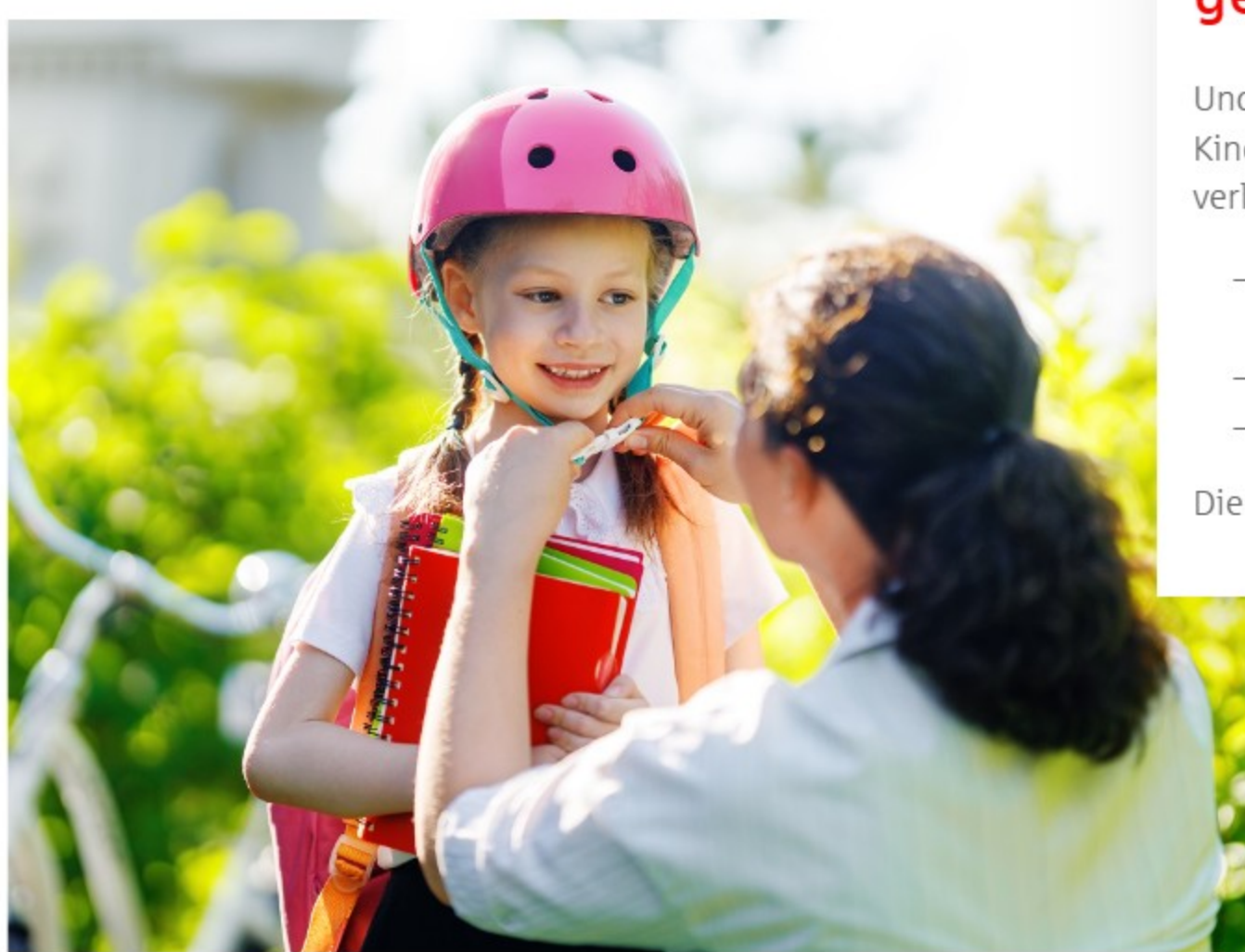
Sicher und selbstständig unterwegs.