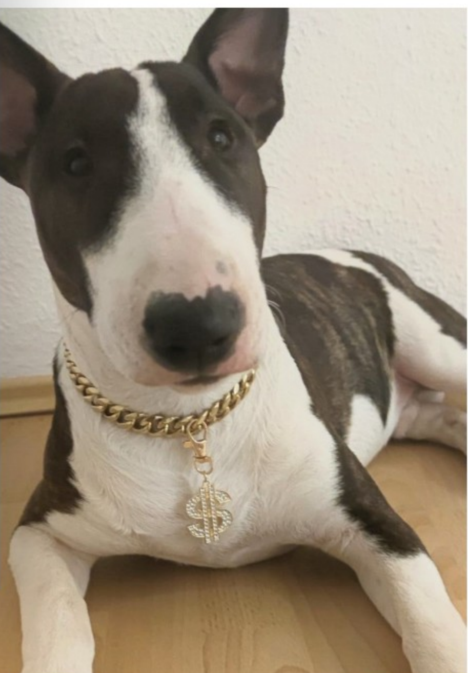
Beim Mini-Bullterrier „Cash“ ist der Name Programm.

Und natürlich gilt: Frauchen und Herrchen behalten als gesetzliche Vertreter jederzeit den Überblick – und erhalten einen kostenlosen Online-Banking-Zugang , um die Finanzen ihres Lieblings mühe los zu überwachen . Ob Leckerli-Ausgabe oder Napf-Abo: Alles im Blick. Alles unter Kontrolle .