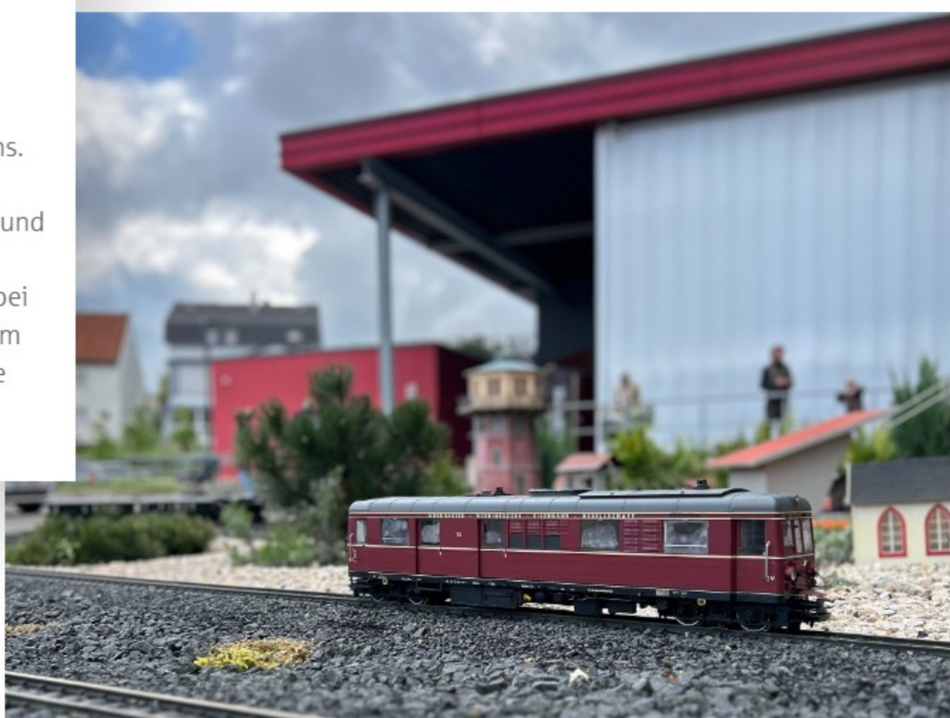
Auf der Außenanlage des Märklineums sind detailreiche Modellzüge unterwegs – ein Highlight für große und kleine Eisenbahnfans.

Überall in der Welt drehen Märklin-Eisenbahnen ihre Runden, doch ihr Zuhause ist Göppingen. Hier begann 1859 die Erfolgsgeschichte des Traditionsunternehmens. Schon um 1900 präsentierte Märklin seine Produkte in einem Musterzimmer . Unzählige Kinder, Jugendliche – und auch erwachsene Fans – hätten allzu gern einen Blick hineingeworfen. Geöffnet wurde der Raum jedoch nur bei geschäftlichen Anlässen. 1958/59 war es dann soweit: Im Stammwerk in der Stuttgarter Straße entstand der erste öffentliche Ausstellungsraum.