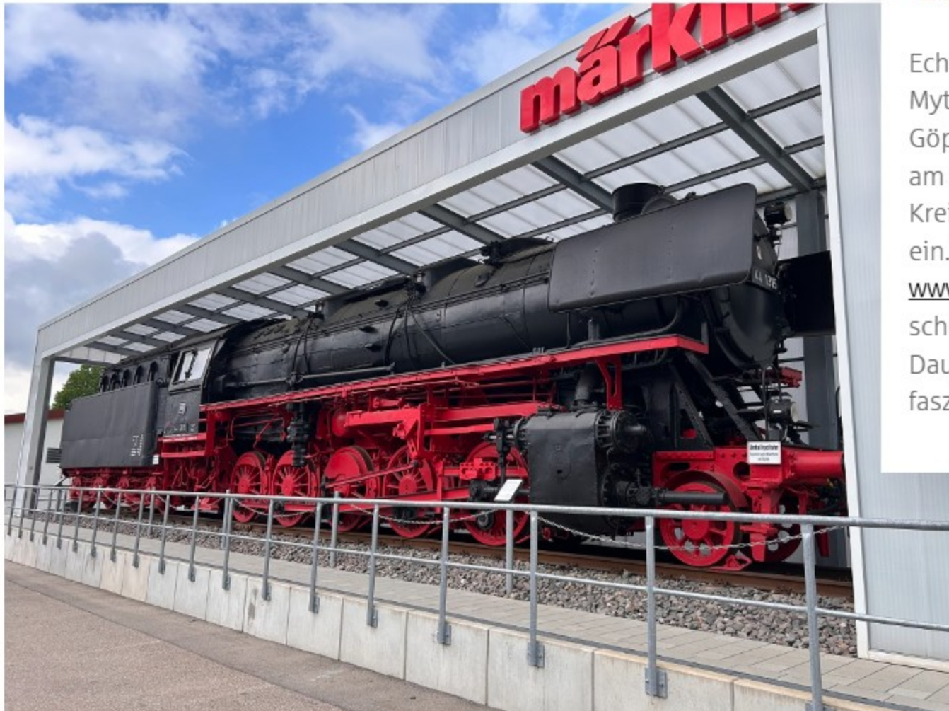
Vor dem Märklineum beeindruckt die historische Dampflokomotive 44 1315 – ein echtes Highlight für Eisenbahnfreunde.

Echte Fans nehmen weite Strecken auf sich, um den Mythos Märklin am Ursprungsort zu erleben. Wer im Kreis Göppingen lebt, hat es da leichter. Das gilt ganz besonders am 3. und 25. Juni. An diesen Tagen lädt die Kreissparkasse Göppingen zu zwei kostenlosen Führungen ein. Wer dabei sein möchte, kann sich im Ticketshop unter www.ksk-gp.de/veranstaltungen Karten sichern. Am besten schnell, denn das Angebot ist begrenzt. Wir drücken die Daumen und wünschen viel Freude beim Eintauchen in die faszinierende Welt von Märklin!