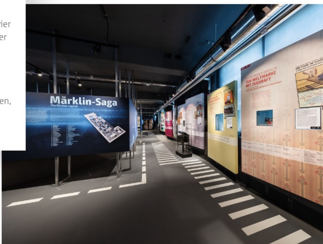
Ein Blick in die Erlebniswelt des Märklineums: Auf vier Ebenen zeigt die Ausstellung die faszinierende Geschichte und Vielfalt der Marke Märklin.

Seit 2021 sind die Märklin-Schätze im Märklineum auf vier Ebenen zu sehen – von klassischem Blechspielzeug über die erste Lok „Storchenbein“ bis hin zu Gesellschaftsspielen und Bausätzen. Ein Highlight ist sicherlich die H0-Modellbahnanlage, die sich über eine Fläche von 160 Quadratmetern erstreckt. Wer näher herantritt, kann nicht nur die historischen Züge studieren, sondern auch viele liebevolle Details in den Miniatur-Städtchen und in der Landschaft entdecken.