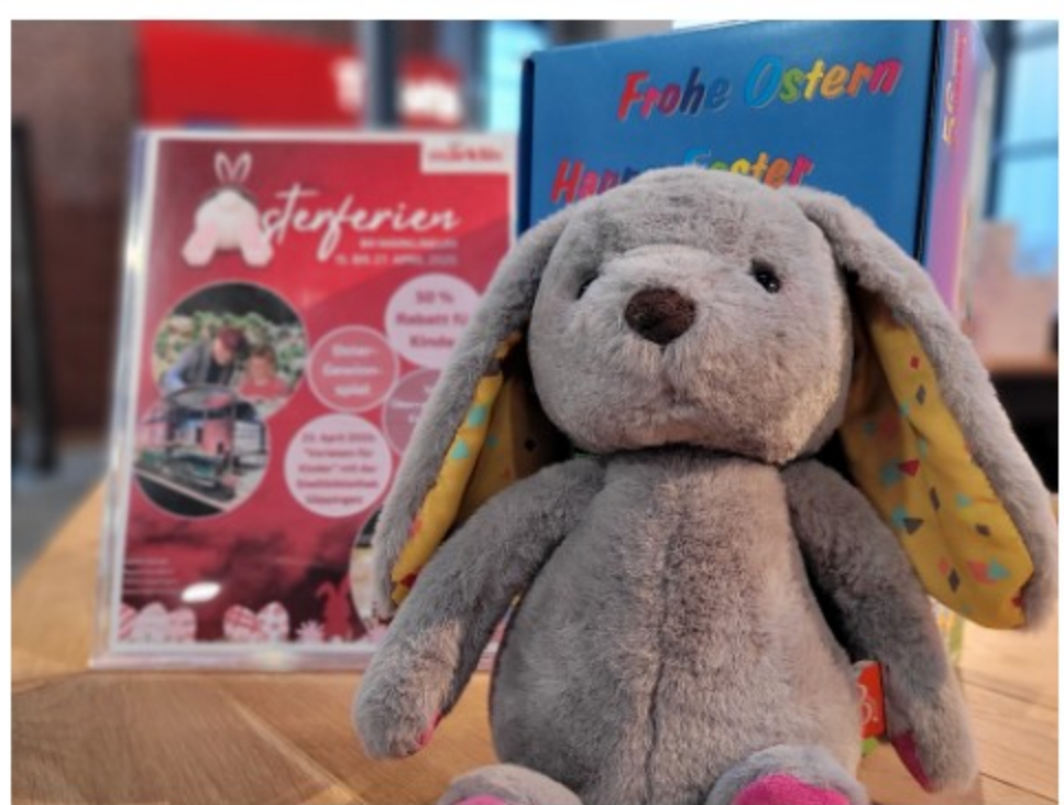
Titelbild: Johanna Neuburger, logografisch.de