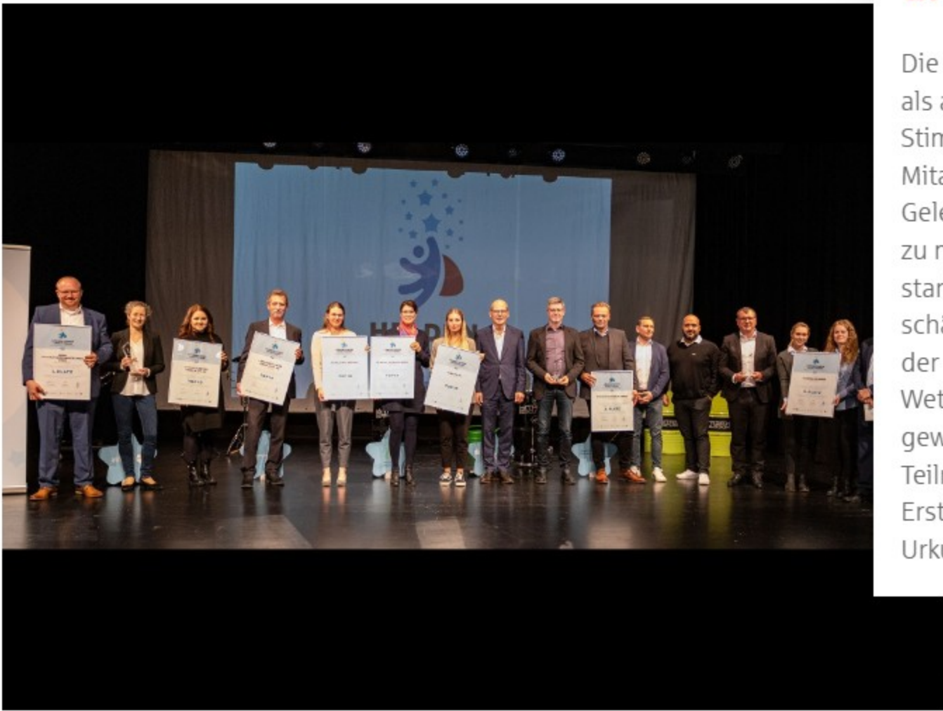
Löwenstarke Arbeitgeber 2023 (Bild anklicken zum Vergrößern)

Die künftigen „Helden“ sollen sowohl von einer Fachjury als auch über ein Online-Voting bewertet werden – mit Stimmen von Kunden, Geschäftspartnern und Mitarbeitenden. Gerade jetzt bietet sich damit eine tolle Gelegenheit, die „Löwenkräfte“ des Stauferkreises sichtbar zu machen. Die Region überzeugt seit jeher mit einer starken, tief verwurzelten Wirtschaft. Unternehmen schätzen den Standort – und besonders das Engagement der vielen Beschäftigten. Dieses Engagement wird im Wettbewerb „Helden der Wirtschaft“ sichtbar gemacht und gewürdigt. Alle teilnehmenden Firmen erhalten ein Teilnahme Siegel zur weiteren Verwendung, die Erstplatzierten sowie weitere Nominierte erhalten eine Urkunde und ein Zertifikat, das ihren Einsatz unterstreicht.