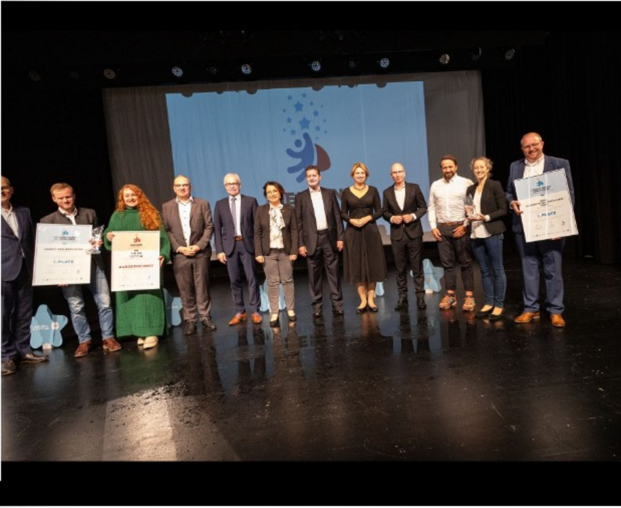
Die Erstplatzierten im Jahr 2023 (Bild anklicken zum Vergrößern)

Themen wie Nachhaltigkeit, Engagement und Recruiting Maßnahmen sind heute für die Unternehmen mindestens genauso wichtig wie guter Service. Das alles soll in die Bewertung einfließen und wird auch inhaltlich abgefragt. Und: Beim Unternehmenspreis wird erstmals auch die Betriebsgröße berücksichtigt – so gibt es eine Einteilung in unterschiedliche Firmengrößen.