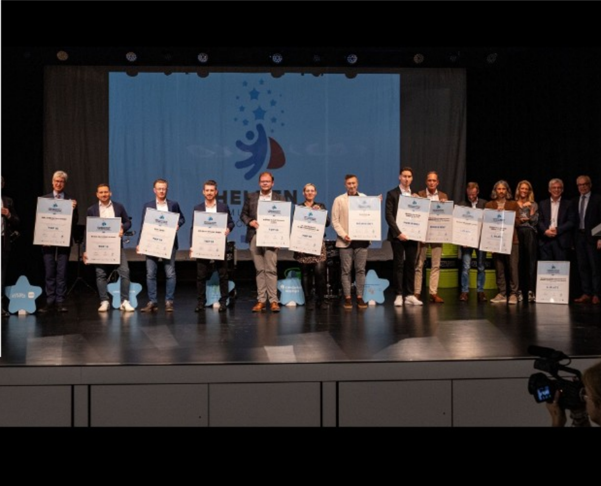
Löwenstarke Unternehmen 2023 (Bild anklicken zum Vergrößern)