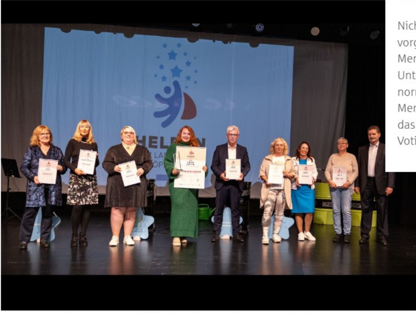
Helden der Herzen 2023 (Bild anklicken zum Vergrößern)

Nicht nur Unternehmen können sich bewerben oder vorgeschlagen werden – es sollen auch ganz besondere Menschen eine Auszeichnung erhalten, die im Unternehmen in ihrem beruflichen Umfeld über das normale Maß hinaus engagiert sind. Denn: Es sind die Menschen, die ein Unternehmen ausmachen. Wer dann das rote Cape erhält, wird dann ebenfalls über ein Online-Voting und der Jury entschieden.