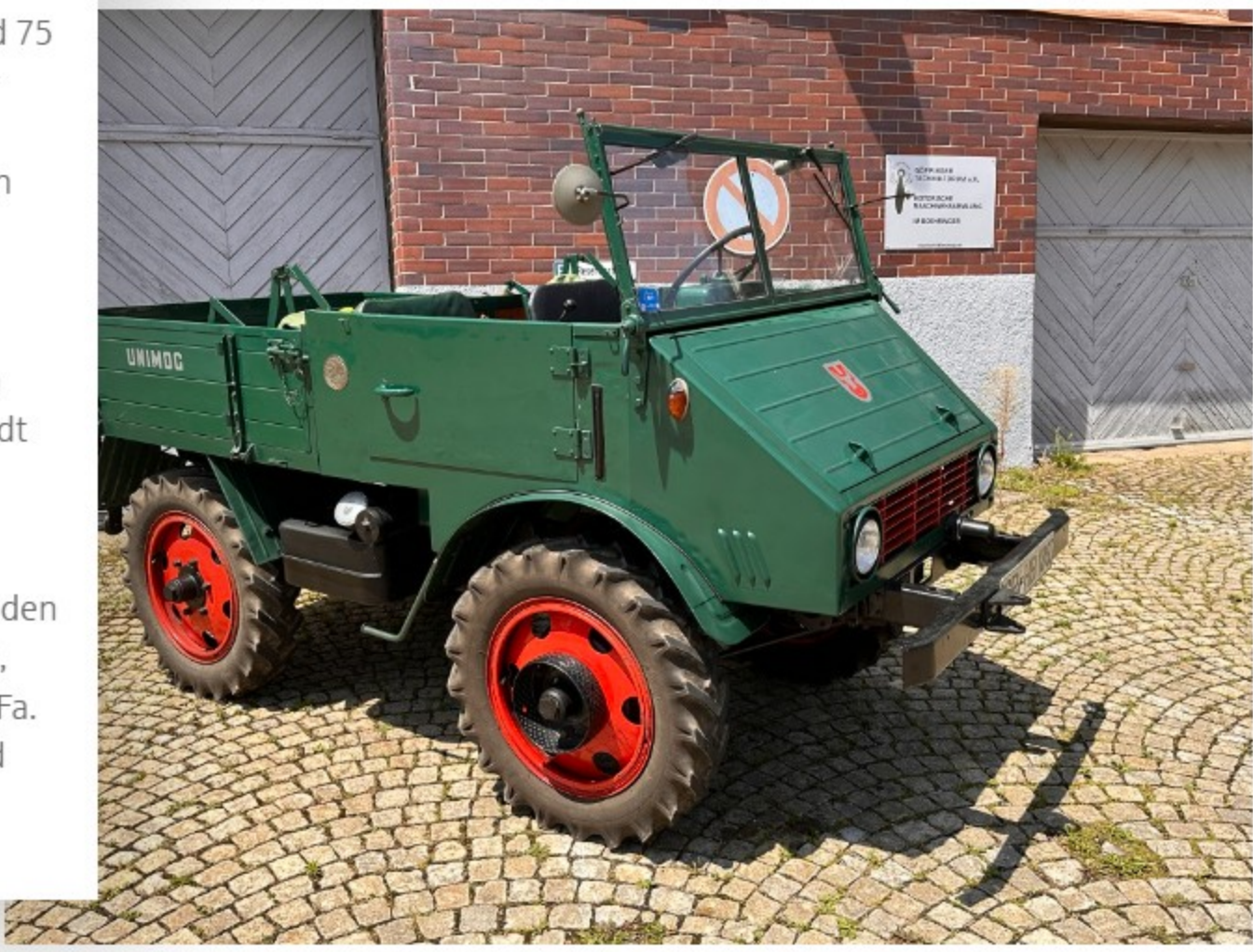
prisma hebt den Schraubenschlüssel zum Gruß – Happy Birthday, lieber Unimog!

Zur Geburtstagsfeier am Sonntag bekommt der größtenteils in Handarbeit gefertigte grüne Jubilar mit den roten Felgen Besuch aus der Gegenwart: Eine moderne, batterieelektrische Volvo FH Electric Zugmaschine der Fa. Weiss wird ihm gegenübergestellt – Vergangenheit und Zukunft vereint in einem eindrucksvollen Bild.