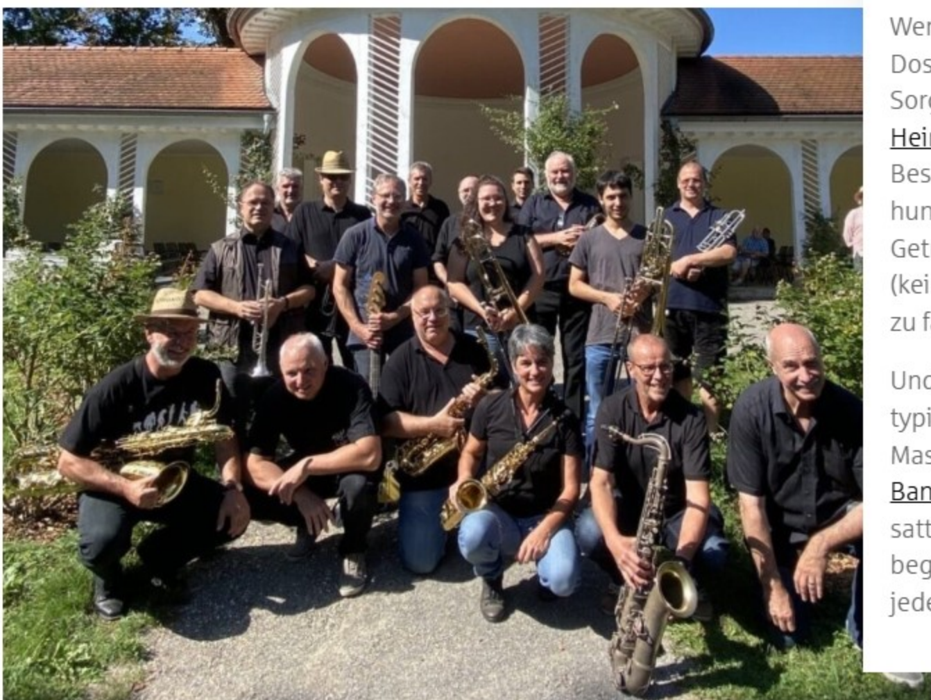
Volle Bandbreite fürs Vereinsfest – die Valley-Connection-Big-Band bringt den Swing!

Und auch für die Ohren gibt's Abwechslung – neben dem typischen Maschinensound aus der historischen Maschinensammlung bringt die Valley-Connection-Big-Band mit rund 20 Musikerinnen und Musikern aus Bad Boll satten Bigband-Sound auf die Bühne. Seit fast 40 Jahren begeistert die Truppe mit Leidenschaft, Spielfreude und jeder Menge Groove.