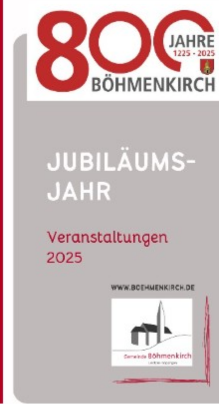
800 Jahre Böhlenkirch – Jubiläumsjahr 2025