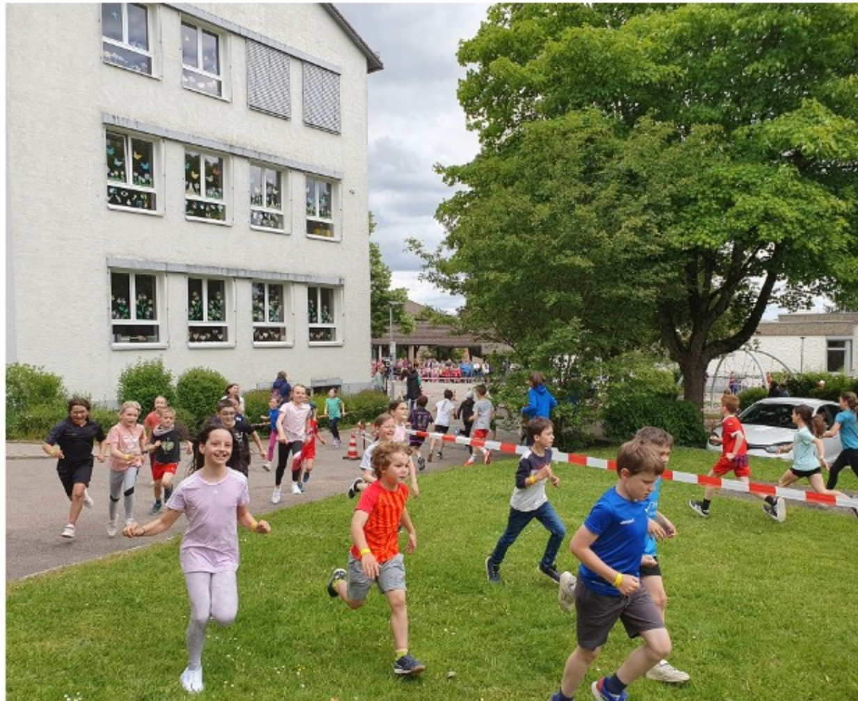
Spendenlauf an der Grundschule Böhlenkirch – voller Einsatz für das Zirkusprojekt

Die Grundschule Böhlenkirch bedankt sich herzlich bei allen Unterstützerinnen und Unterstützern – für jede Runde, jede Spende und jede helfende Hand auf dem Weg zur Manege!