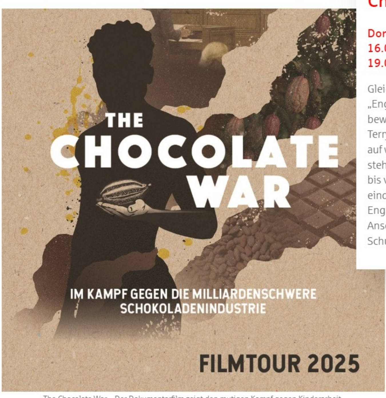
The Chocolate War – Der Dokumentarfilm zeigt den mutigen Kampf gegen Kinderarbeit.

Aufrüttelnd: Filmvorführung The Chocolate War Donnerstag, 26. Juni 2025 16.00 Uhr (Vorstellung für Schulklassen ab Klasse 9) 19.00 Uhr (Öffentliche Vorführung) Gleich zum Auftakt am 26. Juni zeigt das Schulnetzwerk „Engagierte Schule“ den Film The Chocolate War . Die bewegende Doku begleitet den Menschenrechtsanwalt Terry Collingsworth bei seinem Kampf gegen Kinderarbeit auf westafrikanischen Kakaoplantagen. Nestlé und Cargill stehen am Pranger – ein David-gegen-Goliath-Prozess, der bis vor den US Supreme Court geht. Der Film macht eindrücklich sichtbar, wie globale Probleme mit lokalem Engagement ins Bewusstsein gerückt werden können. Im Anschluss gibt es eine Diskussion mit Beteiligten – für Schulklassen wie auch für das interessierte Publikum.