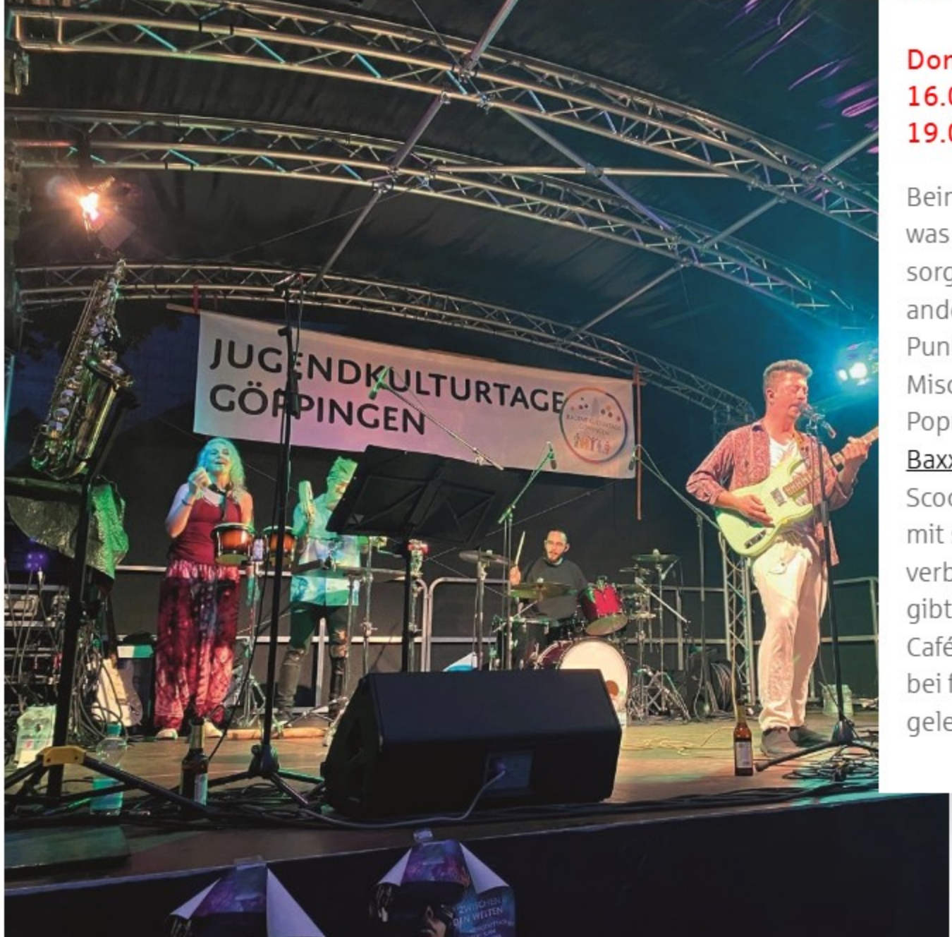
Beim Open-Air auf dem Schlossplatz bringen Bands und kreative Acts die Jugendkulturtage zum Klingeln!

Das große Open-Air auf dem Schlossplatz Göppingen Donnerstag, 26. Juni 2025 16.00 Uhr (Vorstellung für Schulklassen ab Klasse 9) 19.00 Uhr (Öffentliche Vorführung) Beim Open-Air auf dem Schlossplatz am 5. Juli ist richtig was los: Musik, Shows, Mitmachaktionen und Streetfood sorgen für Festivalstimmung. Auf der Bühne stehen unter anderem das inklusive Ensemble Grenzenlos , die Pop-Punkband Liebe Grüsse , Simon Courtier mit einer Mischung aus Conscious Rap, Pop und Reggae, die Poprock-Band Treppenhaus aus Geislingen sowie die Baxter Boys mit einer skurrilen „Dancefloor trifft Punk“-Scooter-Tribute-Show. Der Jugendzirkus Arcobaleno bringt mit seinem neuen Programm „Geschichte(n), die verbinden“ artistische Highlights auf die Bühne. Dazu gibt's eine lebendige Fotobox, Flashmob-Tanz, Spiele im Café Restlos, Mitmachzirkus und vieles mehr. Das Ganze bei freiem Eintritt – ein Tag voller Begegnung, Vielfalt und gelebter Jugendkultur mitten in Göppingen.