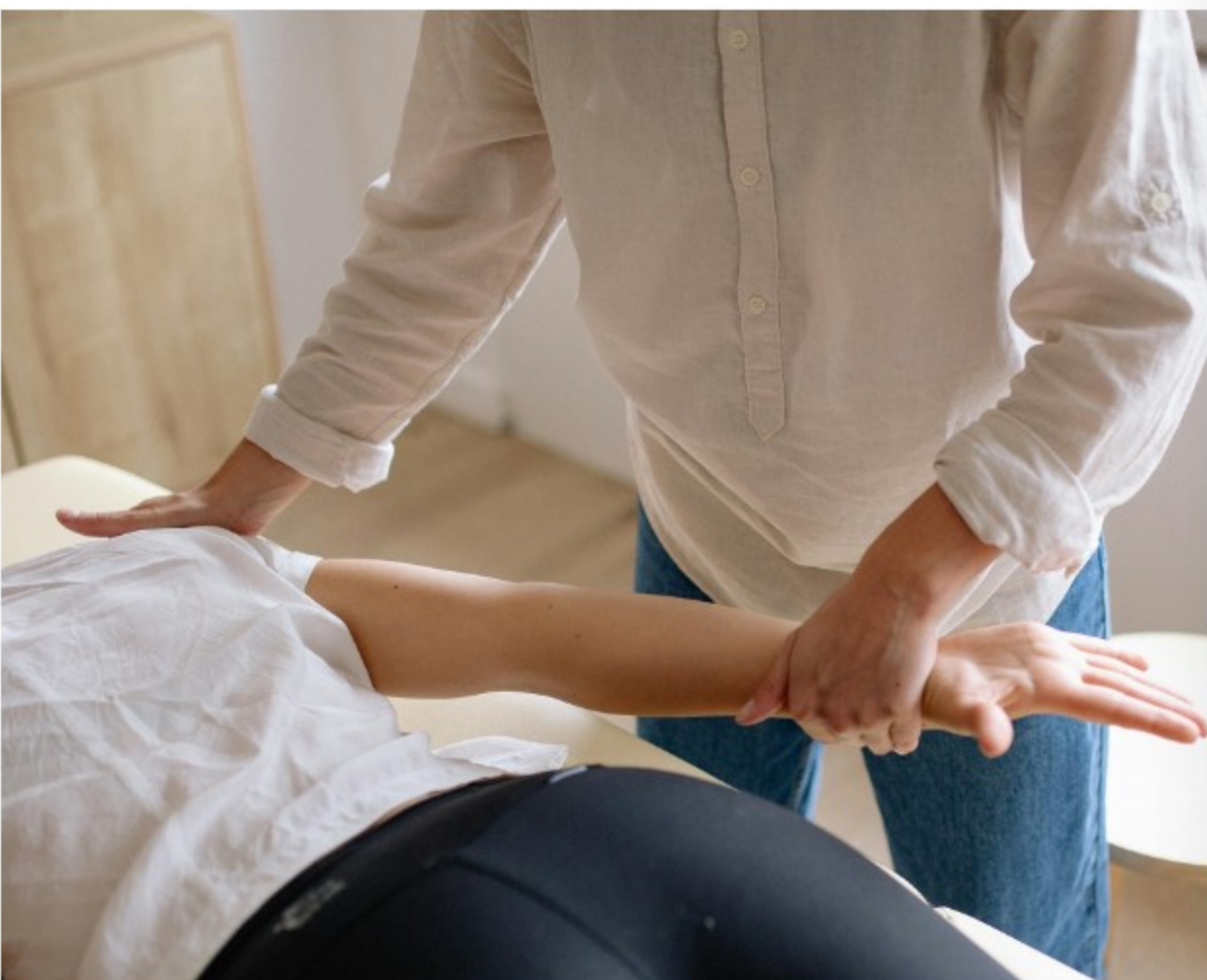
Gezielte Handgriffe zur Behandlung von Muskel- und Gelenkfunktionen – ein Teil der parietalen Osteopathie.