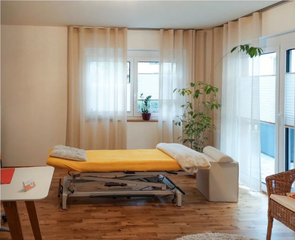
Ein geschützter, freundlicher Raum für sanfte osteopathische Behandlungen – die Praxis in Bad Boll.

„Ich möchte Frauen einen geschützten Raum bieten, in dem sie mit ihren Beschwerden ernst genommen werden – ganz ohne Tabus“, betont sie.