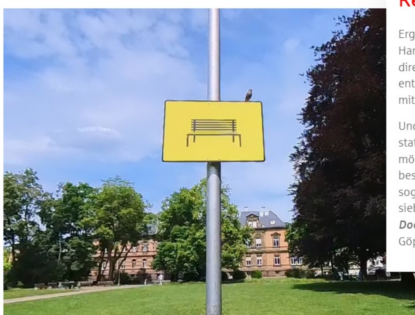
John Wood & Paul Harrison, 21 Signs for a City , 2025. Öffentliche Installation im Stadtraum Göppingen. Szene aus dem 360°-Film Route 21: A City Sign Documentary von Patrick Richter .

Und für alle, die im heißen Sommer nicht gerne laufen und stattdessen lieber in eine Schilderwelt eintauchen möchten, bietet die Kunsthalle im VR-Playground ein besonderes Erlebnis: Jeden Sonntag im Rahmen des sogenannten Rendezvous Digital kann man hier den rund siebenminütigen 360°-Film Route 21: A City Sign Documentary von Patrick Richter ansehen und derweil Göppingen neu entdecken.