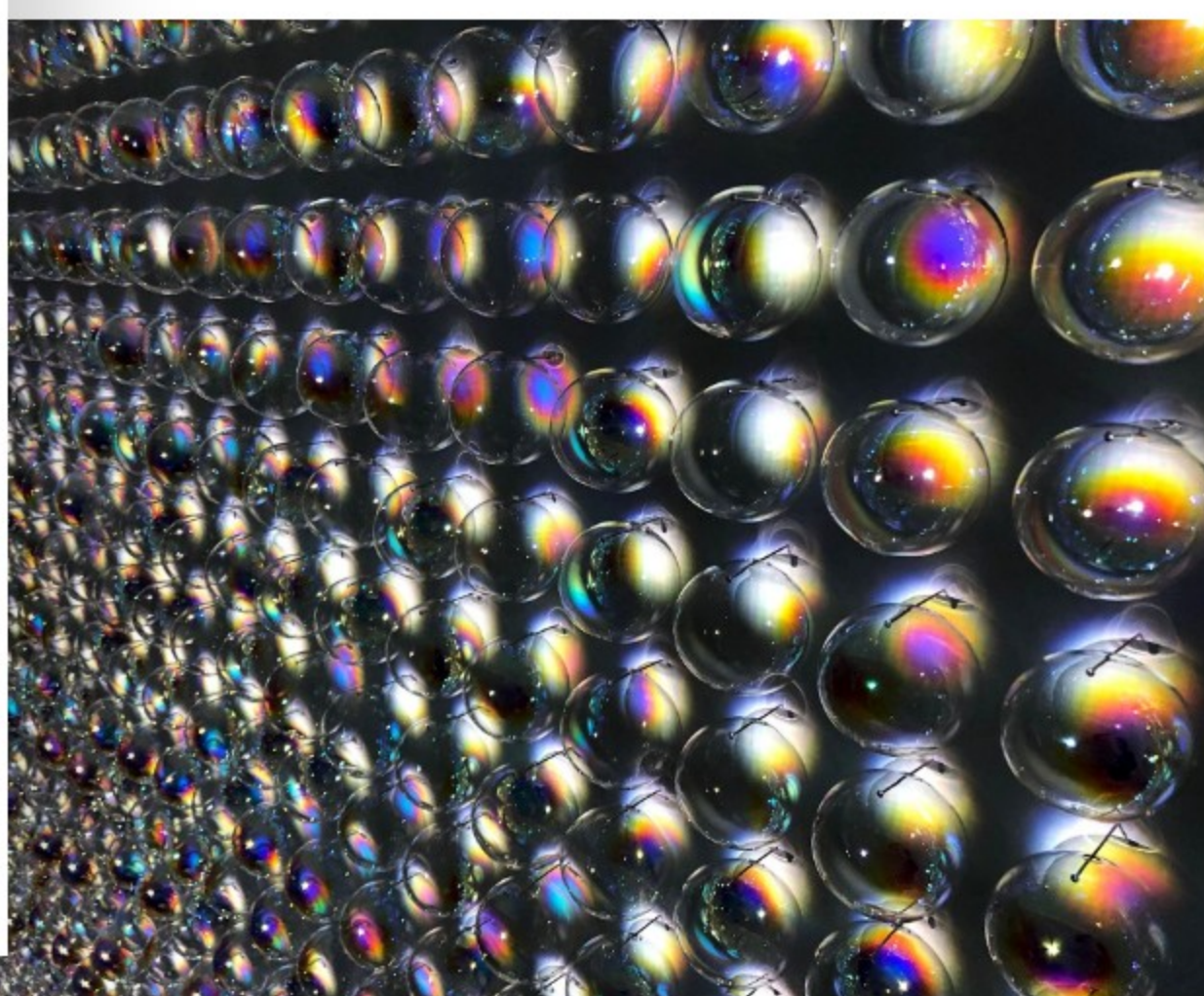
Heike Weber und Walter Eul, treasure , 2021. Computergenerierte Video- und Soundinstallation mit 2.460 mundgeblasenen Hohlglaskugeln, kjubh Kunstverein Köln. © VG Bild-Kunst, Bonn 2025.

Ganz andere Perspektiven eröffnet die Ausstellung Was macht die Kuh im Kühlschrank? Kinder ab drei Jahren (und Erwachsene) entdecken hier Fragen rund um Nachhaltigkeit, Alltag und Zukunft auf kreative, sinnliche Weise. Spielerisch, überraschend und bildungstauglich: Die Kunsthalle denkt groß, auch für die Kleinsten.