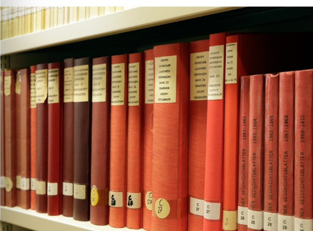
Die systematisch erschlossenen Bestände spiegeln Göppings Geschichte auf 4.000 Regalmeter wider.

Auch wenn der Blick zurückgeht, hilft das Archiv als Wissensspeicher und Gedächtnis der Stadt, Gegenwart und Zukunft fundiert zu gestalten. Es steht im Rahmen der gesetzlichen Vorgaben allen offen – der Stadtverwaltung, der Bürgerschaft und allen historisch Interessierten.