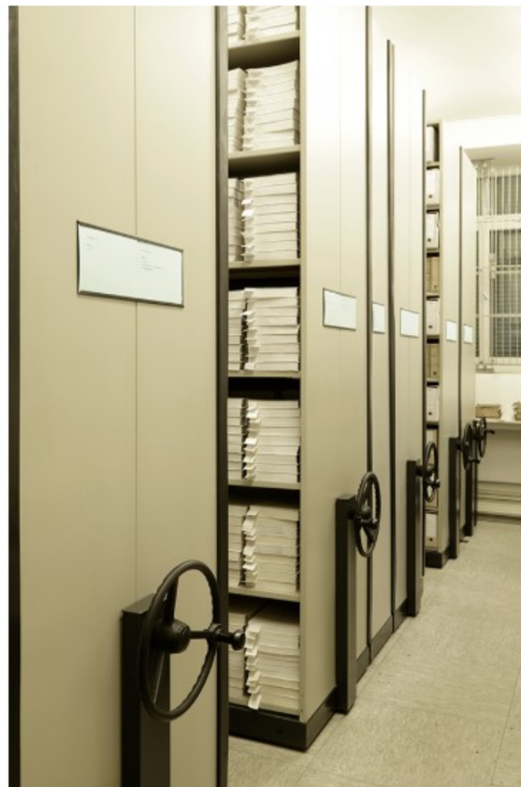
Der Wandel: Von dezentraler Lagerung hin zu einem modernen zentralen Archivmagazin.

Aktuell steht das Archiv vor großen Veränderungen: Die Digitalisierung bringt neue Anforderungen, und die dezentrale und den fachlichen Anforderungen nicht genügende Lagerung der Bestände soll durch ein modernes zentrales Magazin abgelöst werden.