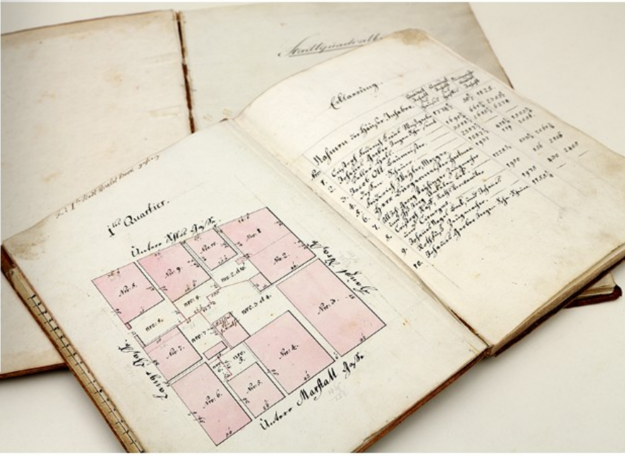
Archivalien wie Stadtpläne, Protokolle und Urkunden machen Geschichte greifbar.

Gerade heute – in Zeiten von Fake News und Deepfakes – gewinnen diese originalen Quellen an Bedeutung. Das Stadtarchiv sorgt dafür, dass sie erhalten bleiben und zugänglich gemacht werden.