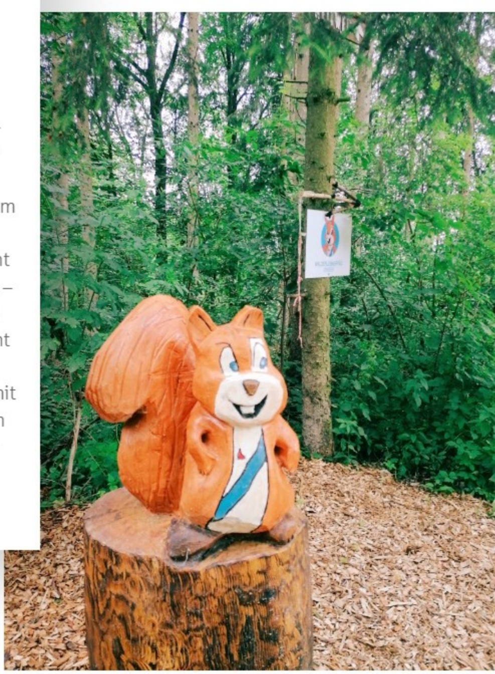
Begrüßung am Walderlebnispfad. Das fröhliche Eichhörnchen von Gingen.

Der Walderlebnispfad in Gingen am Grünenberg ist ein echtes Abenteuer für Familien mit neugierigen Kindern – aber auch Erwachsene kommen hier auf ihre Kosten. Der etwa zwei Kilometer lange Rundweg führt durch einen abwechslungsreichen Wald mit vielen Überraschungen am Wegesrand. An insgesamt 22 liebevoll gestalteten Stationen darf gespielt, gelernt, ausprobiert und gestaunt werden. Ob beim Musizieren, Klettern oder Tiere-erraten – hier wird der Wald zum Erlebnisraum. Wichtig zu wissen: Der Pfad ist nicht für Kinderwagen geeignet, denn es geht teilweise recht steil bergauf und bergab. Dafür ist die Strecke umso spannender für wanderfreudige Familien mit etwas Kondition. Startpunkt ist der Parkplatz am früheren Grüngutplatz, direkt zwischen Gingen und Grünenberg – dort beginnt das Naturabenteuer, das Spaß, Bewegung und Entdeckerlust verbindet.