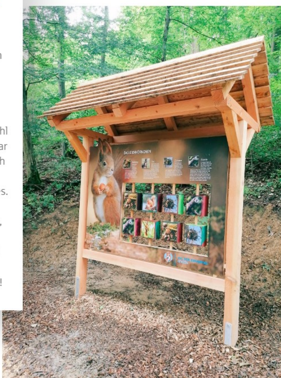
Entdecken und Lernen: Eichhörnchenstation am Walderlebnispfad Gingen.

Richtig lebendig wird der Walderlebnispfad in Gingen am Grünenberg bei den vielen Mitmachstationen, die zum Ausprobieren einladen. Beim großen Waldxylophon können Kinder ihrer Kreativität freien Lauf lassen. Mit einfachen Holzschlägeln lassen sich eigene Melodien erzeugen. Sogar ganz ohne Noten, sondern nur mit Gefühl und Fantasie. Der Wald wird so zum Klangraum, und sogar Erwachsene greifen gern mal selbst zu den Stäben. Gleich daneben geht es sportlich weiter: In der Sprunggrube messen sich Kinder spielerisch mit den Tieren des Waldes. Wer springt so weit wie ein Fuchs? Und wer schafft es vielleicht bis zur Rehmarkierung? Dabei wird viel gelacht, gehüpft und ausprobiert. Ergänzt wird das Ganze durch Infotafeln zu Tierspuren, Bäumen und Pflanzen – so wird Wissen ganz nebenbei vermittelt. Ein Erlebnis für Kopf, Körper und Herz – und Langeweile hat hier keine Chance!