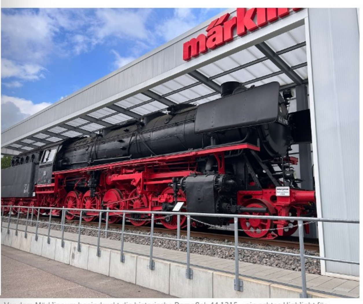
Vor dem Märklineum beeindruckt die historische Dampflok 44 1315 – ein echtes Highlight für Eisenbahnfreunde.

Auf insgesamt 49.000 Quadratmetern erwarten die Gäste drei Tage voller Spiel, Spaß und Staunen. Ein abwechslungsreiches Programm mit Werksführungen, Kinderaktionen, Modellbahn-Schauanlagen und einem vielseitigen kulinarischen Angebot verspricht ein Fest für die ganze Familie.