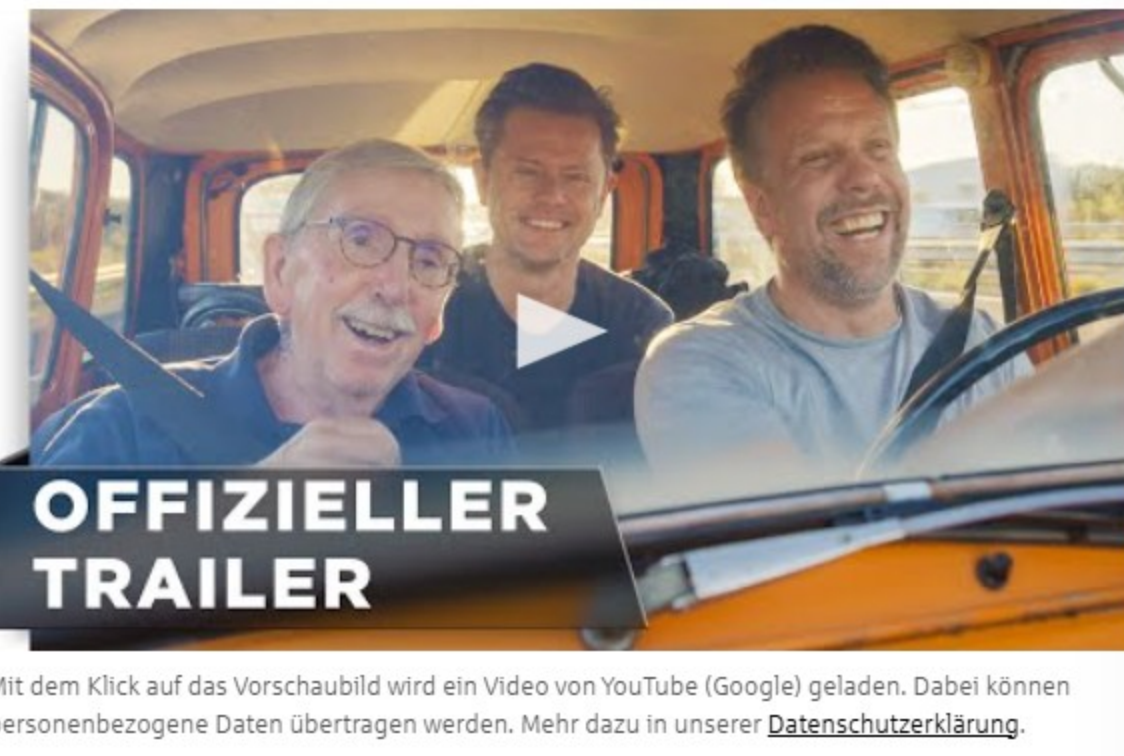
Mit dem Klick auf das Vorschaubild wird ein Video von YouTube (Google) geladen. Dabei können personenbezogene Daten übertragen werden. Mehr dazu in unserer Datenschutzerklärung .