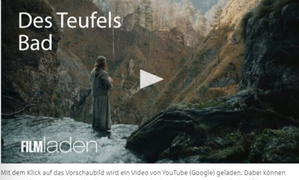
Mit dem Klick auf das Vorschaubild wird ein Video von YouTube (Google) geladen. Dabei können personenbezogene Daten übertragen werden. Mehr dazu in unserer Datenschutzerklärung .