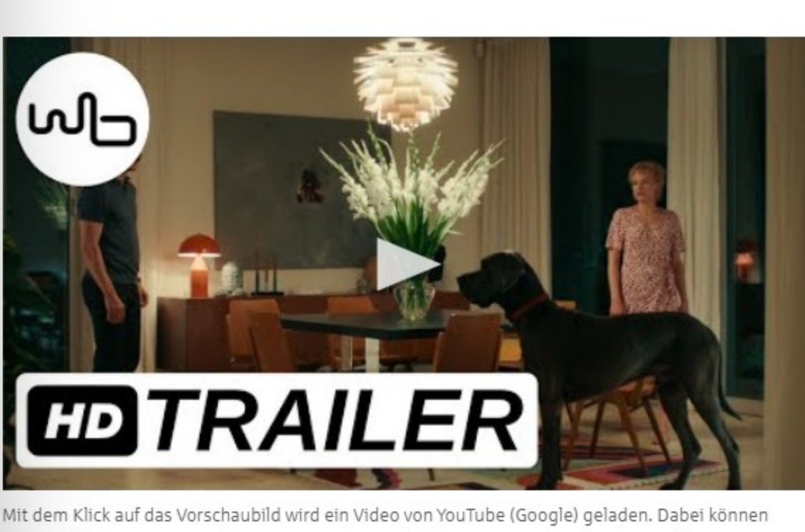
Mit dem Klick auf das Vorschaubild wird ein Video von YouTube (Google) geladen. Dabei können personenbezogene Daten übertragen werden. Mehr dazu in unserer Datenschutzerklärung .