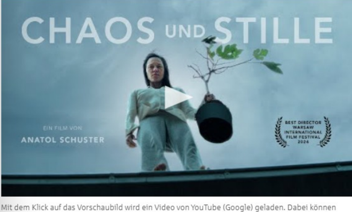
Mit dem Klick auf das Vorschaubild wird ein Video von YouTube (Google) geladen. Dabei können personenbezogene Daten übertragen werden. Mehr dazu in unserer Datenschutzerklärung .