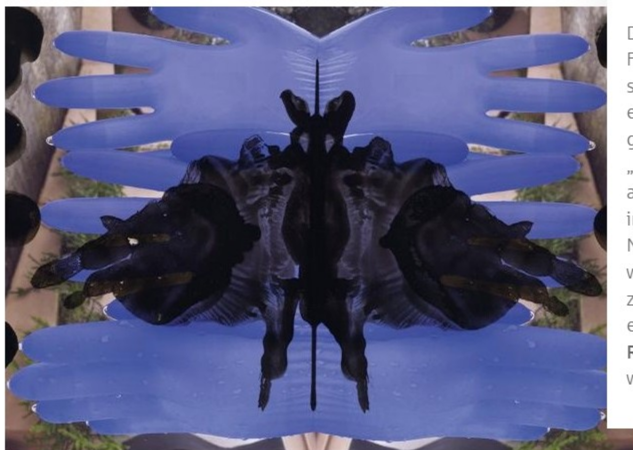
Spiegelung und Farbe in der Rorschach Ausstellung Göppingen.

Das Ausstellungsprojekt stammt vom Schweizer Fotografen Heinz Hebeisen, der seit vielen Jahren mit seiner Familie in Madrid lebt. In seinen Arbeiten erforscht er die Schnittstelle zwischen Wissenschaft und Kunst, und genau daraus entsteht seine besondere Bildsprache. Für „RE-Think Rorschach“ greift er das Prinzip der Spiegelung auf, kombiniert es mit analogen Fotografien und interpretiert es künstlerisch neu. Seine Werke regen zum Nachdenken über Wahrnehmung und Projektion an, während sie zugleich zeigen, wie fließend die Grenzen zwischen Analyse und Ästhetik sein können. Dadurch entsteht ein vielschichtiger Zugang zum bekannten Rorschach-Test, der Besucherinnen und Besucher immer wieder neu zum Entdecken einlädt.