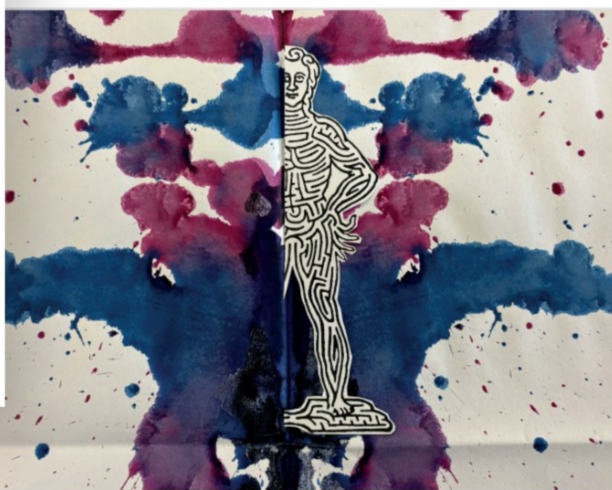
Motiv aus „RE-think Rorschach“ von Heinz Hebeisen. © Heinz Hebeisen / MuSeele Göppingen

Zur Vernissage am 29. Oktober 2025 im MuSeele / DANEBEN dürfen sich die Gäste auf einen besonderen Nachmittag freuen. Heinz Hebeisen wird persönlich anwesend sein und Einblicke in seine Arbeit geben. Ergänzt wird die Eröffnung durch Beiträge von Expertinnen und Experten aus Psychologie und Kunst, die über Bedeutung und Wirkung des Rorschach-Tests sprechen. Die Ausstellung „RE-Think Rorschach“ ist bis Ende April 2026 zu sehen und lädt dazu ein, das Zusammenspiel von Wissenschaft, Kunst und menschlicher Fantasie neu zu entdecken.