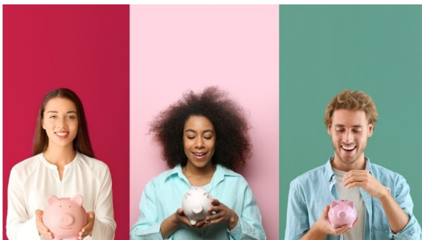
Ob Urlaub, Anschaffung oder Notgroschen: Spartöpfe helfen, individuelle Sparziele einfach zu erreichen.*

Wer einmal damit angefangen hat, merkt schnell, wie motivierend klare Ziele sind . Es macht einfach Spaß zu sehen, wie das Urlaubssparen wächst oder der neue Sofatopf langsam voller wird. Spartöpfe bringen Struktur ins Sparen und ein kleines Erfolgserlebnis bei jedem Blick ins Online-Banking.