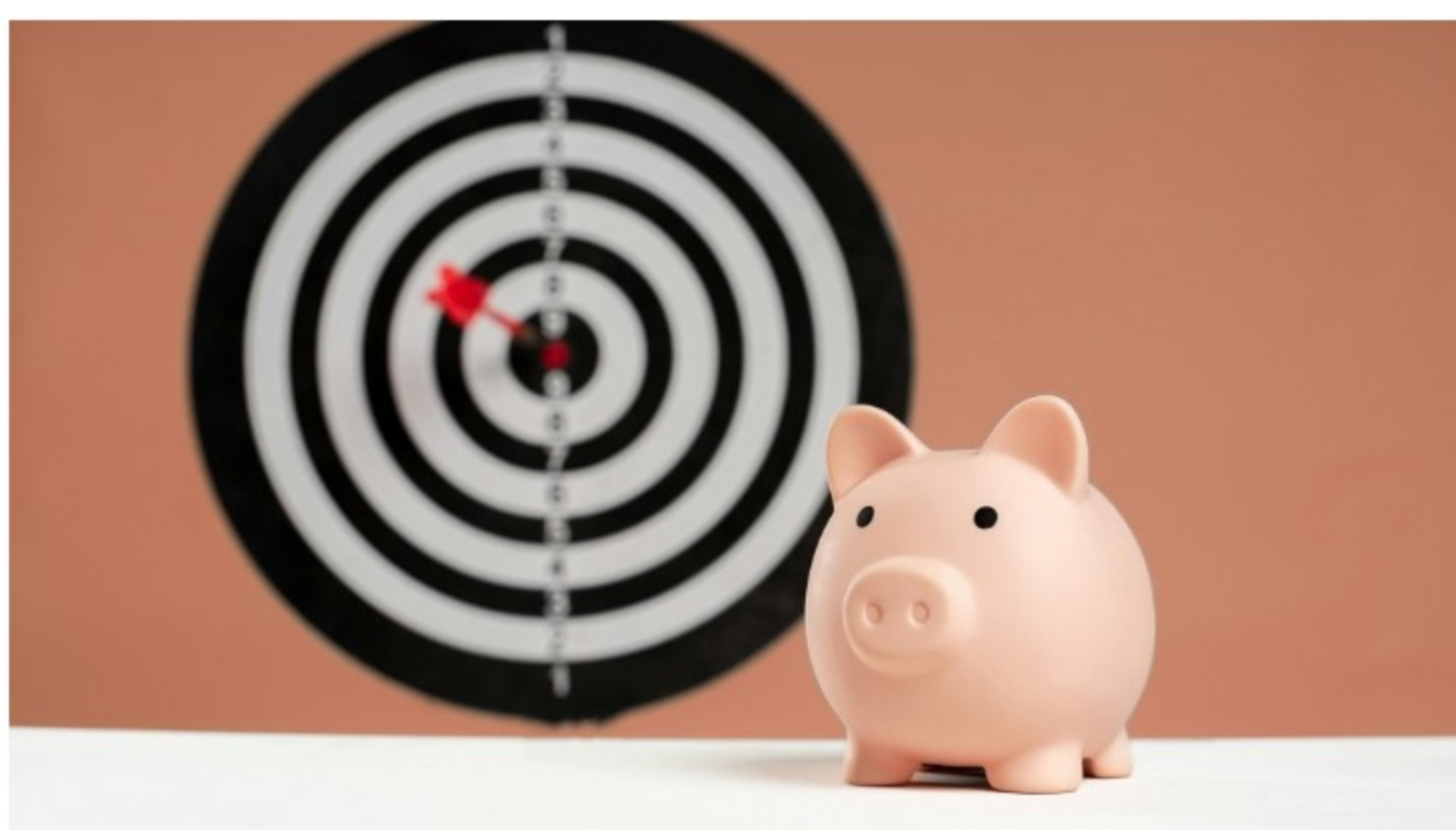
Sparen mit Ziel: Mit den Spartöpfen lässt sich Geld gezielt und übersichtlich für persönliche Wünsche zurücklegen.