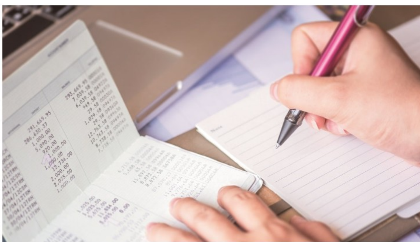
Früher mühsam mit Kontoauszug und Stift – heute digital mit dem Finanzplaner.

Früher hieß es: Kontoauszüge zur Hand nehmen, Belege abheften und mit Stift und Taschenrechner die Zahlen eintragen. Das war mühsam und kostete viel Zeit.