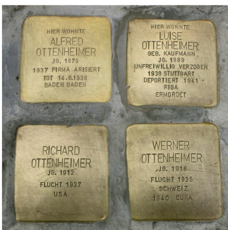
Die vier Stolpersteine der Familie Ottenheimer vor ihrem ehemaligen Wohnhaus in Göppingen.