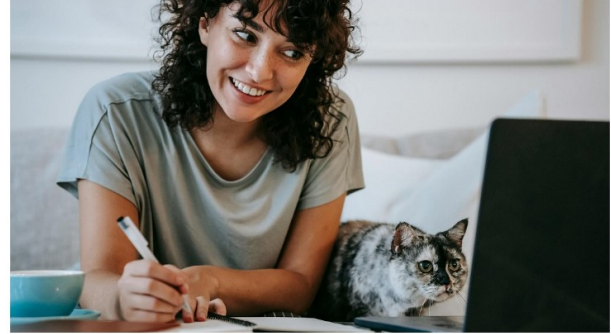
Muffin staunt: Die Fotoüberweisung läuft schneller als er zum Napf.

Im Online-Banking am Computer funktioniert die Fotoüberweisung genauso bequem wie in der App. Wählen Sie im Menü „Überweisung“ die Funktion „Rechnung hochladen“ aus und öffnen Sie die gewünschte Datei. Nach dem Hochladen erkennt das System automatisch alle wichtigen Angaben und trägt sie in das Formular ein. Sie prüfen nur noch die Daten und geben den Auftrag wie gewohnt frei. So wird das Bezahlen digitaler Rechnungen sehr einfach. Die Fotoüberweisung eignet sich für Rechnungen, Bestellungen, Honorare, Mitgliedsbeiträge oder Überweisungsträger. Wenn Sie also das nächste Mal Ihr Smartphone zücken, um Ihren Stubentiger zu fotografieren, können Sie gleich auch noch eine Rechnung ablichten. Mehr Infos rund um die Fotoüberweisung finden Sie hier: -> Fotoüberweisung | Kreissparkasse Göppingen Und nun wünsche ich Ihnen viel Glück beim S-Adventskalender und viel Spaß beim Fotografieren, ganz gleich ob Katze oder Rechnung. Ihre Ina Awischus