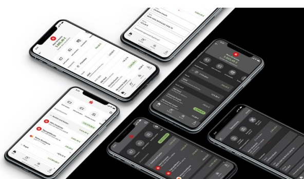
Ob hell oder dunkel, die Übersicht bleibt gleich gut.

Die App Sparkasse kann mehr als das gewohnte Online-Banking. Sie bietet zusätzliche Funktionen, die Banking im Alltag noch einfacher machen. Die Spartöpfe habe ich Ihnen ja bereits vorgestellt.