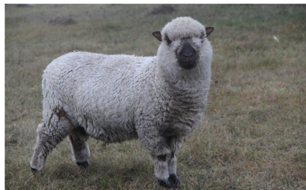
Schaf Finni will ins Trockene gebracht werden.