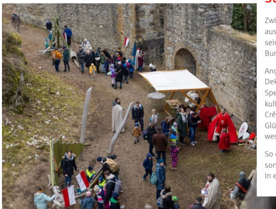
Schmuck, Strudel, Seife und Stockbrot. Alles, was das Ritterherz begehrt.

So entsteht ein Markt, der nicht auf Eile ausgelegt ist, sondern Raum lässt zum Stöbern, Genießen und Verweilen in einer besonderen Umgebung.