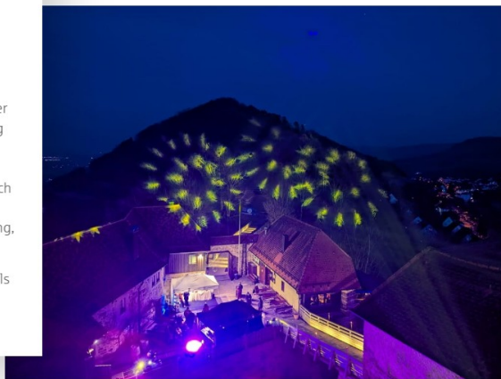
Wenn die Burg im Lichterglanz erstrahlt, braucht es gar keinen Schnee mehr.

Schnell wird klar, dass der Winterzauber hier mehr ist als ein Markt. Es ist ein Ort, an dem Geschichte und Gegenwart ganz selbstverständlich zusammenfinden.