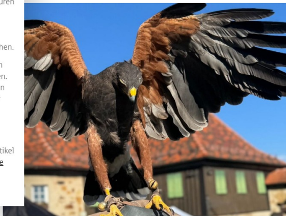
Luie, der neue Burgbewohner, hat beim Winterzauber alle Flügel voll zu tun.

Tipp: Wer die Burg Hohenrechberg auch abseits des Winterzaubers entdecken möchte, findet im prisma -Artikel „Auf Entdeckungsreise mit dem Spielplatzbienenchen: Die Burgruine Hohenrechberg“ viele Tipps für einen familienfreundlichen Ausflug.