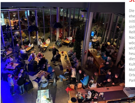
Der Weihnachtsjam der Jazz-iG bringt regelmäßig Musikbegeisterte im ehemaligen Tresor zusammen.