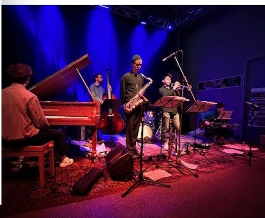
Die offenen Sessions der Jazz-iG finden regelmäßig im ehemaligen Tresor im Weber Park statt.

Wenn mittwochabends Musik aus dem ehemaligen Tresor im Göppinger Weber Park klingt, steckt ganz bestimmt die Jazz-iG (Jazz-Interessengemeinschaft, Jazz-in-Göppingen oder natürlich auch einfach „jazzig“) dahinter. Seit vielen Jahren organisiert der Verein Konzerte und offene Sessions, bei denen sich erfahrene Musiker, junge Talente und Musikbegeisterte begegnen. Gespielt wird nicht nur Jazz. Auch Blues, Salsa, Weltmusik und experimentelle Klänge gehören zum Programm. Besonders die offenen Sessions machen den Reiz der Abende aus. Instrumentalisten und Vocalisten jeden Alters sind eingeladen mitzumachen und gemeinsam zu improvisieren. So entsteht Woche für Woche eine lebendige Atmosphäre, die zeigt: Die Jazzszene im Filstal ist bis heute aktiv und vielfältig.