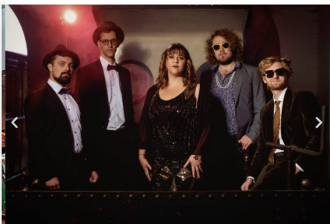
Square City Stompers.